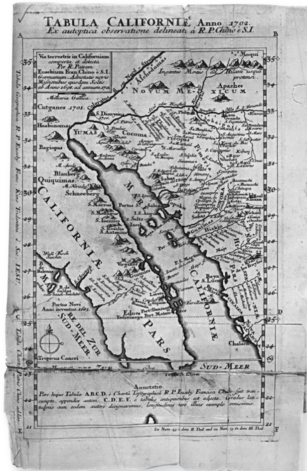
Fig. 3. Mapa atribuido al Padre Eusebio Francisco Kino, confirmando que California es una península