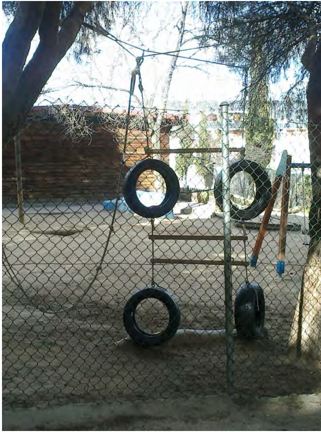
Zona del jardín. Nivel: jardín de infancia