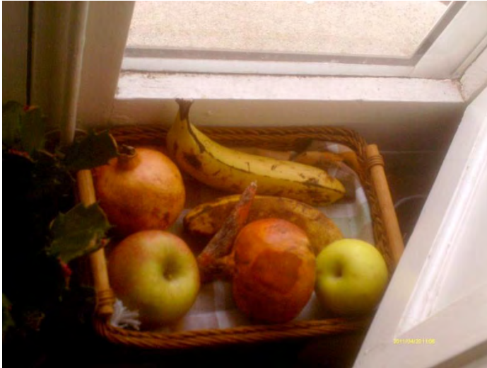
Fruta para el almuerzo. Nivel: jardín de infancia