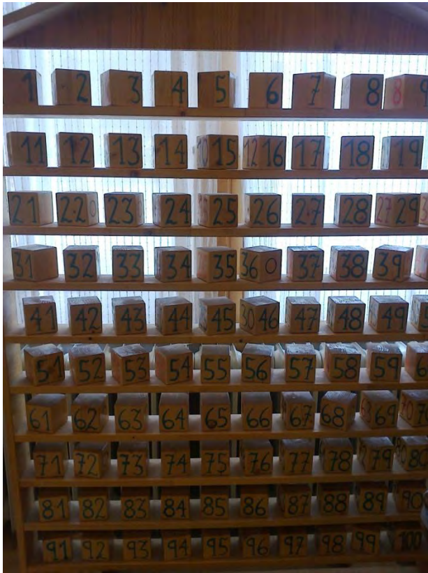
Material referente al ámbito de las matemáticas. Nivel: primaria 1ª - 6ª clase