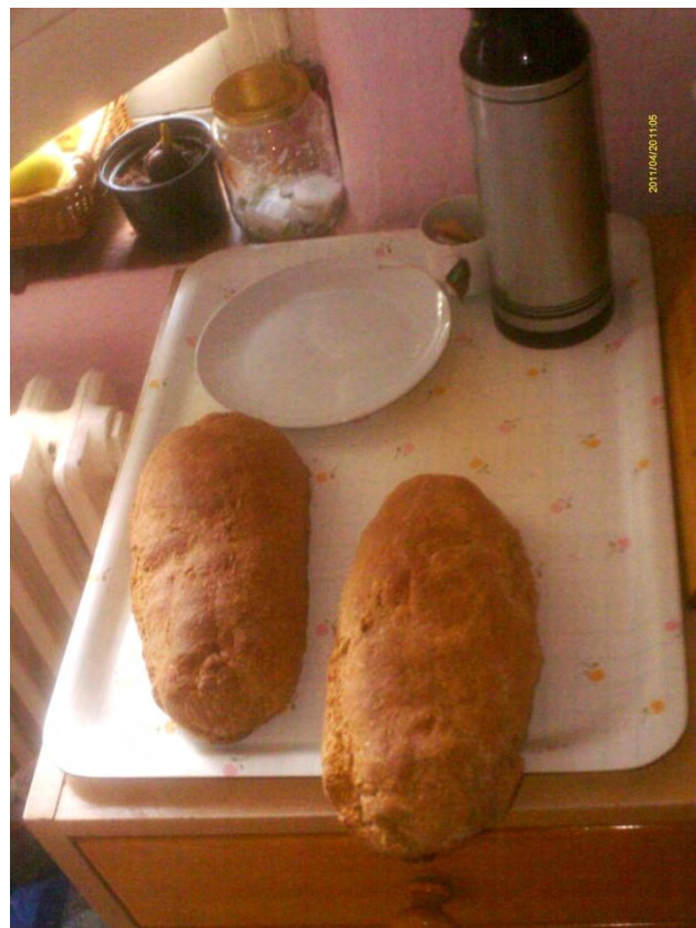
Día de hacer pan. Nivel: jardín de infancia