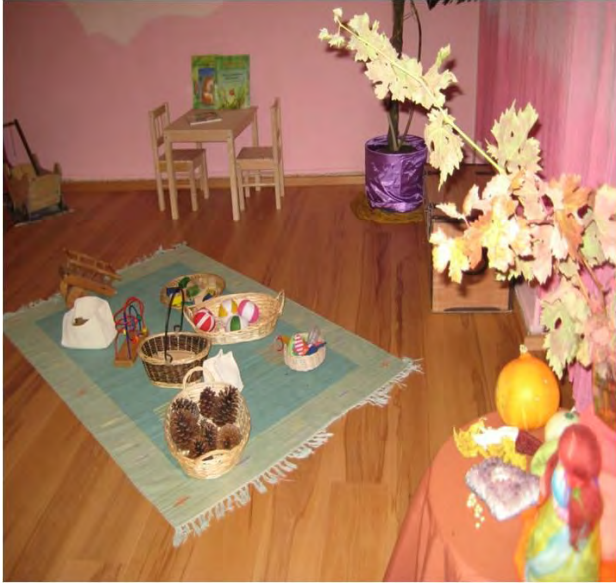
Momento de juego libre, recogida de materiales. Nivel: jardín de infancia