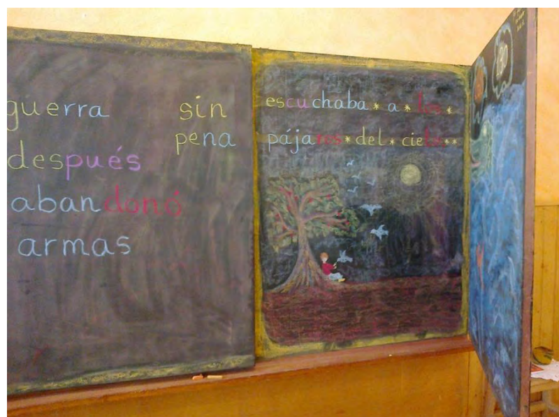
Pizarra, momento de “lecto-escritura”. Nivel: primaria 1ª - 6ª clase