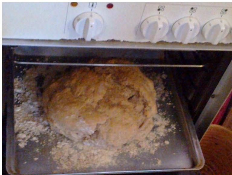
Día de hacer pan. Nivel: jardín de infancia