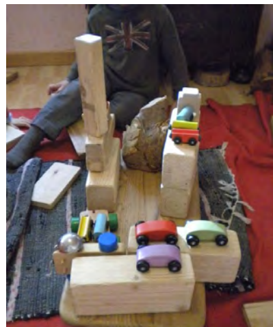
Momento de juego libre

Según van acabando, se lavan las manos y se van a jugar, ya que es momento del juego libre. Mientras ellos/as juegan por el aula de manera no dirigida, Paqui y yo lavamos los instrumentos utilizados, limpiamos la mesa, metemos el pan al horno... Todo ello delante de los niños/as, ya que es sin salir del propio aula.