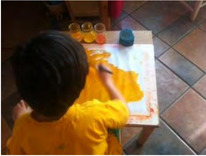
Día de pintar con acuarela Nivel: jardín de infancia