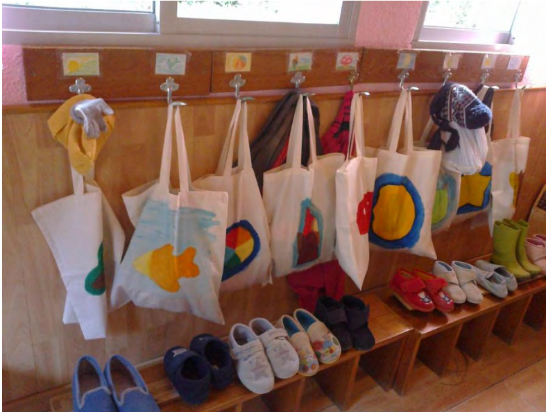
Rincón para el cambio de calzado. Nivel: jardín de infancia