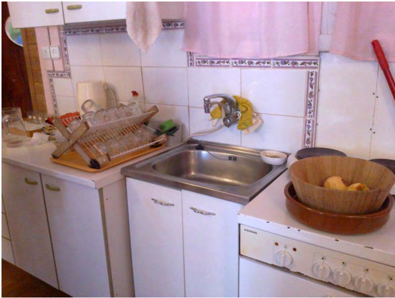
Zona de la cocina. Nivel: jardín de infancia