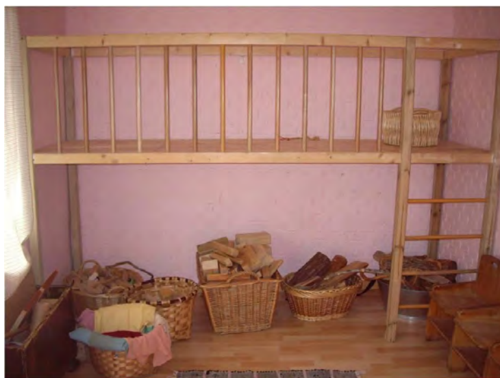
Material de juego. Nivel: jardín de infancia