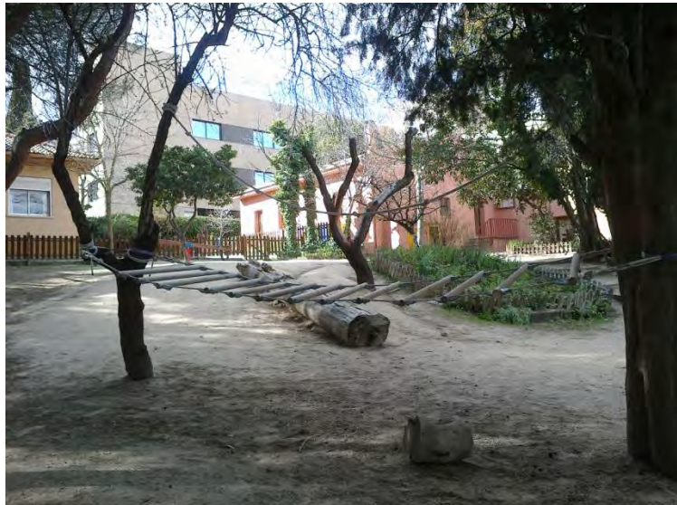
Zona del jardín. Nivel: primaria y secundaria