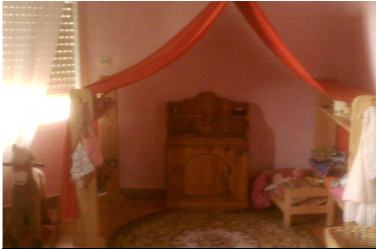
Distribución espacial. Zona de juego.

Pero respecto a lo que nos compete, que son los espacios de las escuelas Waldorf, el modelo de estructura en cuanto al espacio es bastante distinto al tradicional que se da hoy en día. En el jardín de infancia no cuentan con las típicas mesas y sillas donde los niños/as trabajan, ya que al ser un