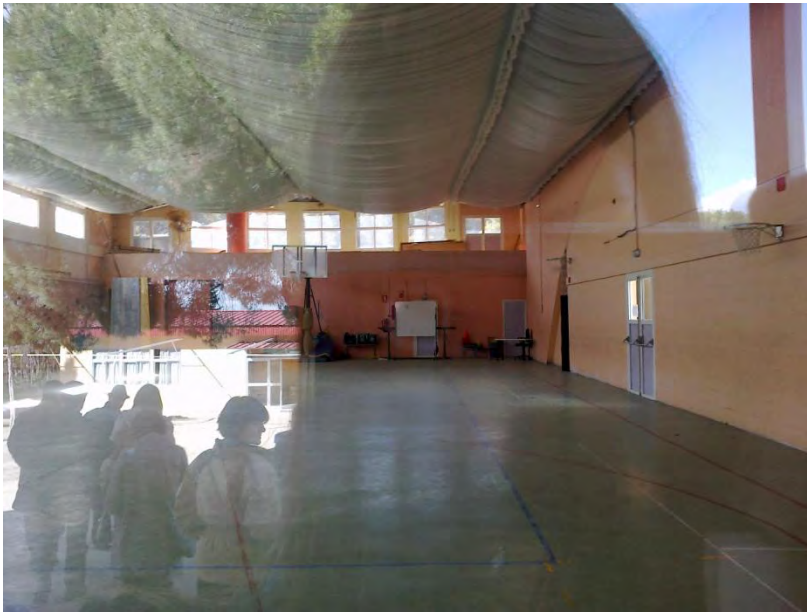
Gimnasio. Nivel: primaria y secundaria