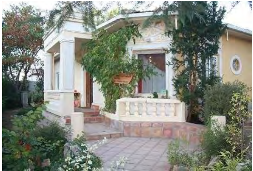
Entrada a la escuela