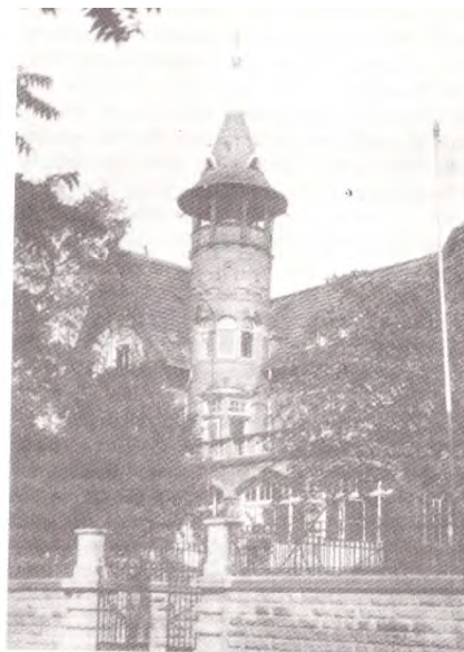
El primer colegio Waldorf en Stuttgart (Alemania)

La Pedagogía Waldorf, propuesta por Steiner, lleva este nombre debido al origen de la primera escuela Waldorf. Fue al año siguiente de acabar la Primera Guerra Mundial cuando el propietario de la fábrica de cigarrillos Waldorf-Astoria, Emil Molt , en Stuttgart (Alemania), le preguntó a Steiner por la posibilidad de fundar un colegio para los hijos/as de los trabajadores de dicha fábrica.