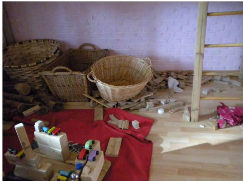
Momento de juego libre. Nivel: jardín de infancia