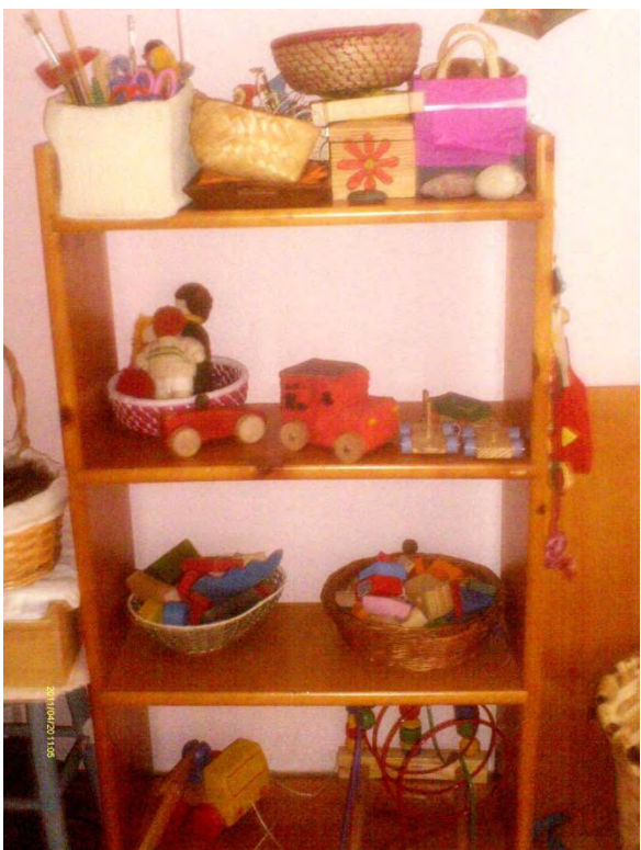
Estantería con material de juego. Nivel: jardín de infancia