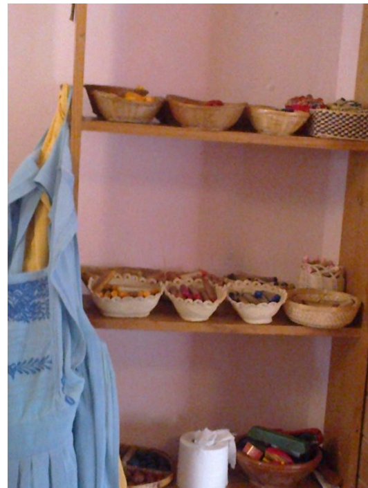
Estantería con material. Nivel: jardín de infancia