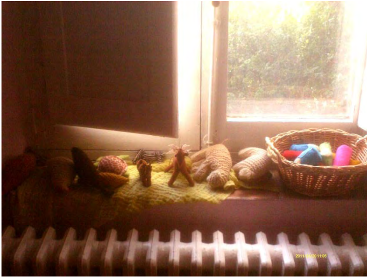
Material de juego, muñecos de lana. Nivel: jardín de infancia