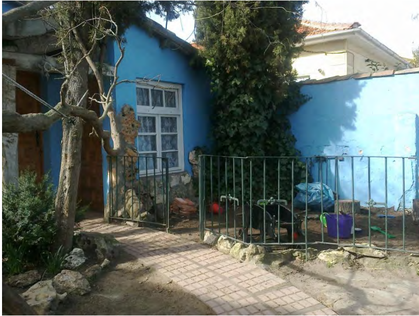
Zona del jardín. Nivel: jardín de infancia