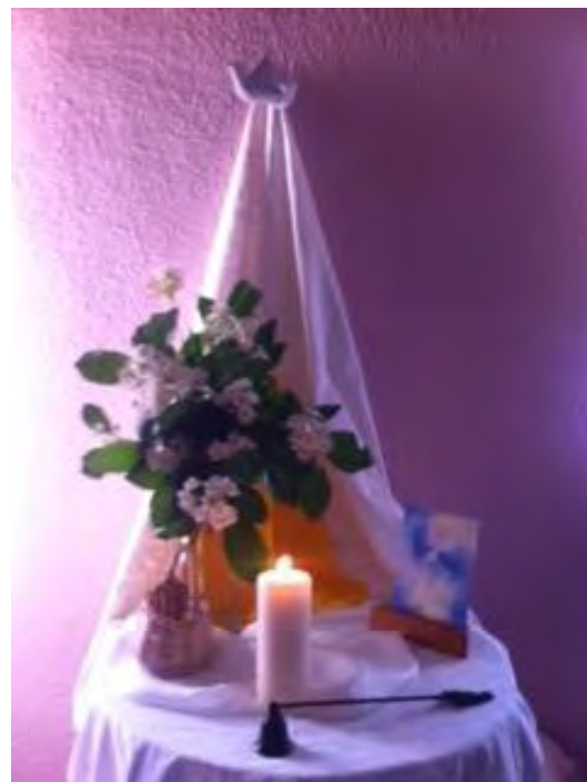
Mesa de las estaciones. Nivel: jardín de infancia