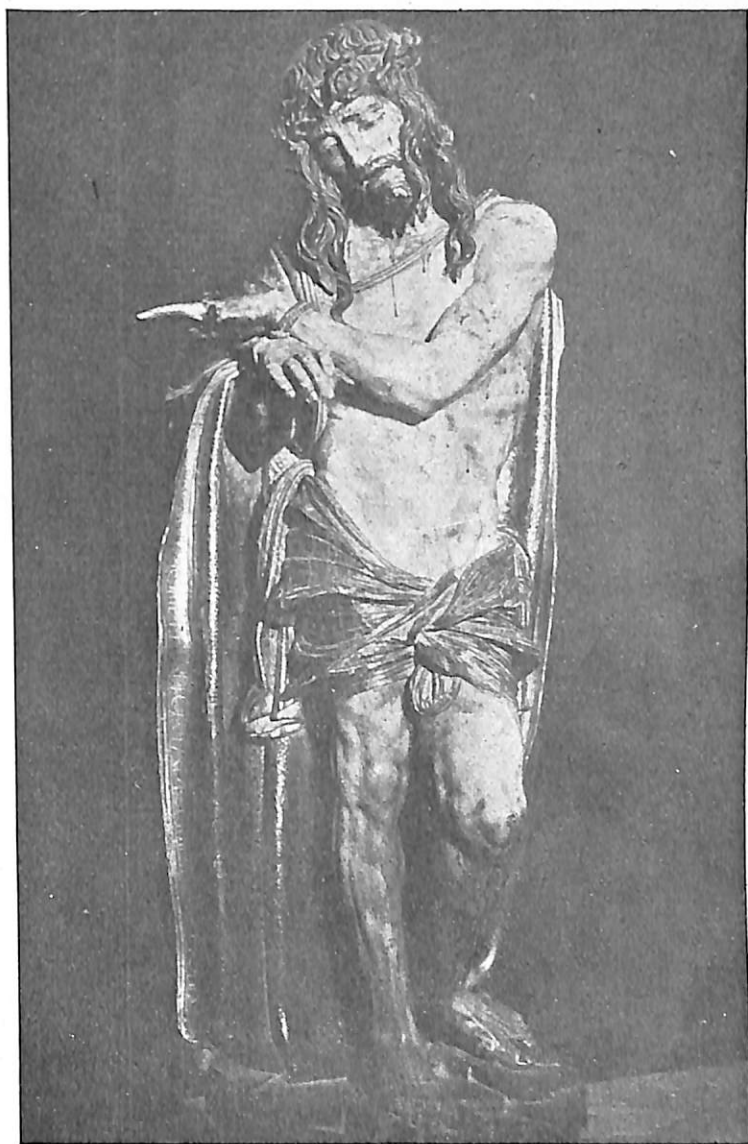
LÁMINA I.—Diego Silóee.—Eccehomo. Ermita de San Agustín. Dueñas (Palencia)