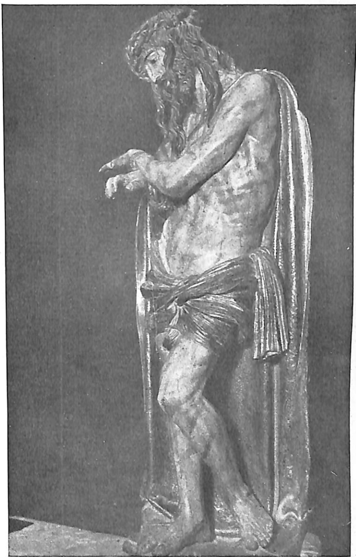
LÁMINA. II.—Diego Silóee.—Eccehomo. Ermita de San Agustín. Dueñas (Palencia).