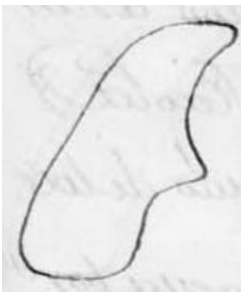
Silueta de la localidad situada en el margen izquierdo de las Respuestas Generales

Estamos ante una ciudad que es realenga, ya que pertenece a Su Majestad y depende de la contaduría de la ciudad de Soria. Se pagan por esta razón los siguientes derechos: por los cuatro unos por ciento se pagan 12.000 reales, por el salario ordinario y extraordinario 4.217 reales, por los Reales Servicios 8.000 soldados y, derechos de las velas de sebo se pagan 16.198 reales y 8 maravedís, por los nuevos impuestos en carnes y 3 millones 5.399 reales y 14 maravedís, por el equivalente del derecho de aguardiente 1.354 reales y un maravedí. El montante de todo lo que se paga a Su Majestad alcanza los 39168 reales y 23 maravedís.