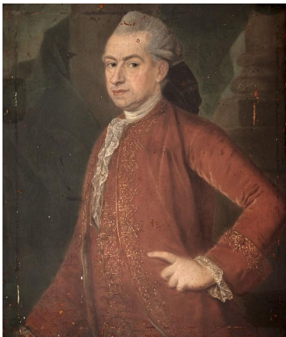
Retrato del Marqués de la Ensenada de su casa de Medina del Campo

La llegada de Zenón a las instituciones del Estado se produjo de la mano de José Patiño, Intendente del Ejército y Marina, a las órdenes del Alberoni. El encuentro se produjo en una