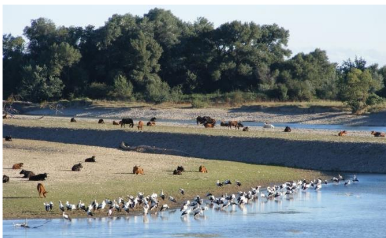
Reserva natural Sotos del Ebro de Alfaro

Hoy en día siguen existiendo estos mismos Sotos en la Ribera del Ebro. Alfaro cuenta con