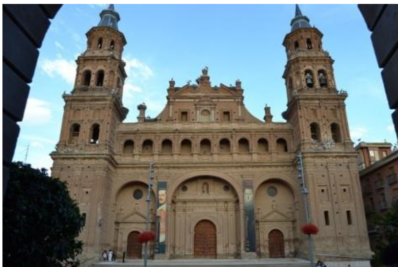
Colegiata de San Miguel de Alfaro

En Alfaro se paga el diezmo y la primicia. El primero es la décima parte de la cosecha y la primicia equivale a uno de 30 de los frutos que se obtienen. No están gravados por el diezmo y la primicia las aceitunas, frutas, cañamones y verduras.