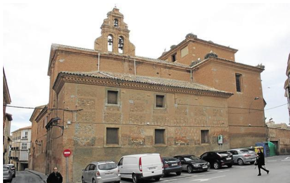
Convento de la Concepción de Alfaro