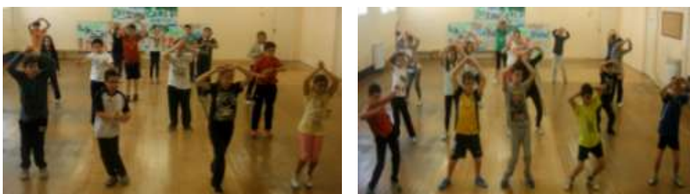
Figura XI: imagen de 5ªA y 5ªB interpretando pasos de la canción “Gata brasileira”.