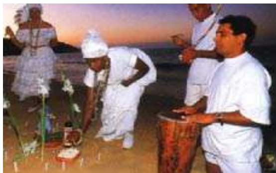
Figura V: macumba.

Como se ha comprobado, la influencia de la música africana es innegable, siendo también el origen también el origen de rituales afro-brasileños: Macumba, Candomble y Congadas.