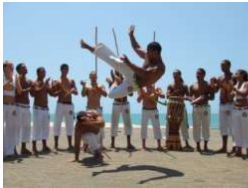
Figura VII: roda de capoeira donde dos adversarios luchan al ritmo del berimbau.

La coreografía que se realiza se llama gingado. Pese a tener movimientos básicos, se trata de algo complicado de realizar, ya que la imaginación y la creación son algo necesario. Al mismo tiempo, se fomenta el respeto; tanto por la tradición del ritual y la conservación de la tradición, como por el contrincante.