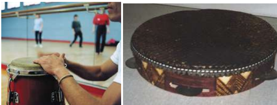
Figura III y IV: imagen de un Tabaque y un Pandeiro.