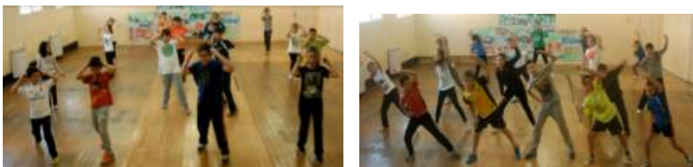
Figura IX: imagen de 5ªA y 5ªB interpretando pasos de la canción “Chi ki cha”.

He de decir que en algunos momentos, los alumnos estaban cansados y poco motivados, pero que al final, todo tiene recompensa: el vídeo final. Este resultado final se puede ver en el anexo VI del DVD. Se encuentran las tres coreografías realizadas por cada una de las clases (un total de seis), cuyo orden de realización y por consiguiente de dificultad es el siguiente: “Chi ki cha”, “Bum bum” y “Gata Brasileira”.