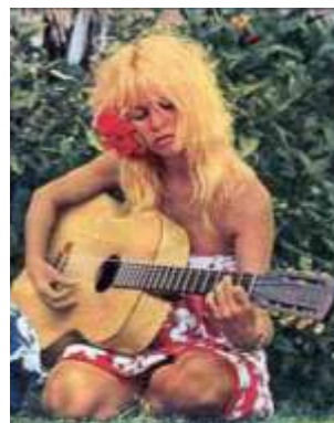
Figura II: imagen de un violao.