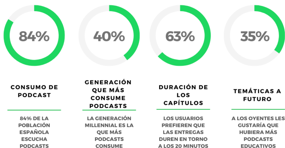
Gráfico 1. Elaboración propia a partir del informe de hábitos de consumo de Spotify

Según el último informe realizado por la plataforma de streaming Spotify 1 , publicado en el año 2021, sobre los hábitos de consumo de podcasts de los españoles, un 84% de la población española escucha podcasts , de los cuales un 33% lo hace a diario. Respecto a las edades de consumo, la generación de los millennials son los que más frecuentemente escuchan podcasts – un 40% – respecto a otras generaciones, como la Z (28%) o los Baby Boomers (17%).