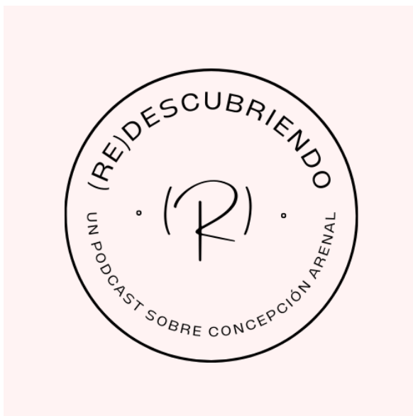
Ilustración Imagen que acompaña al capítulo piloto. Elaboración propia

La imagen que acompaña al capítulo piloto fue elaborada a través de la plataforma virtual Canva .