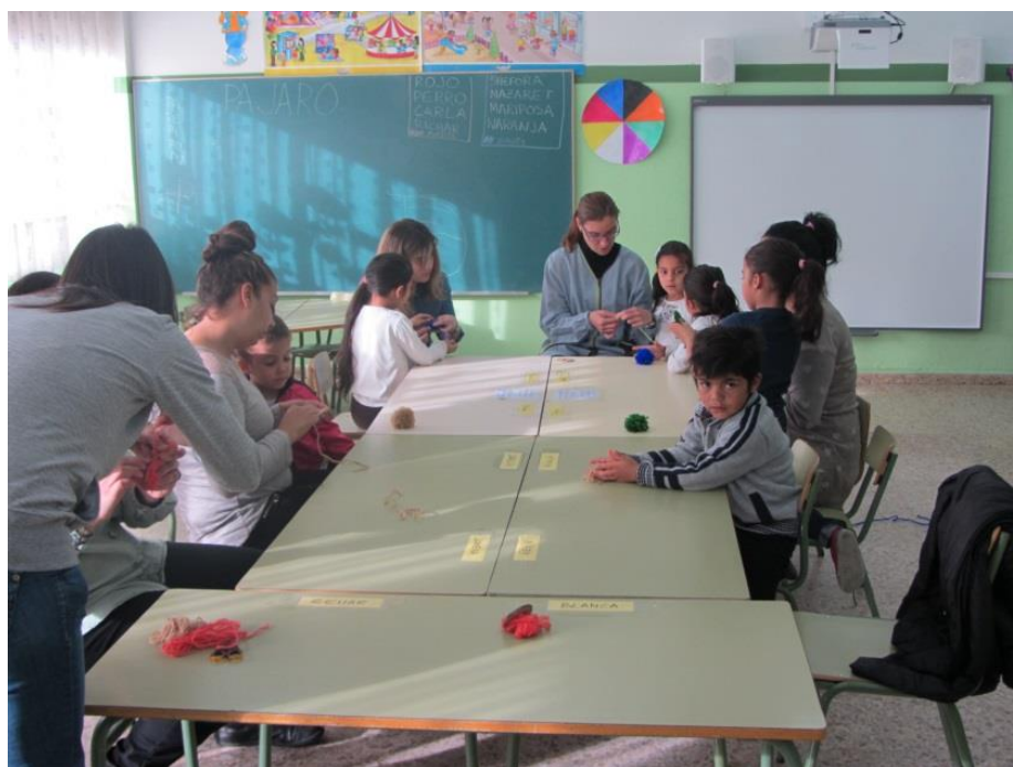
Figura 1. Familias participando en las actividades propuestas

En estas fotografías (figuras 1 y 2) se puede observar a las familias colaborando en los talleres propuestos.