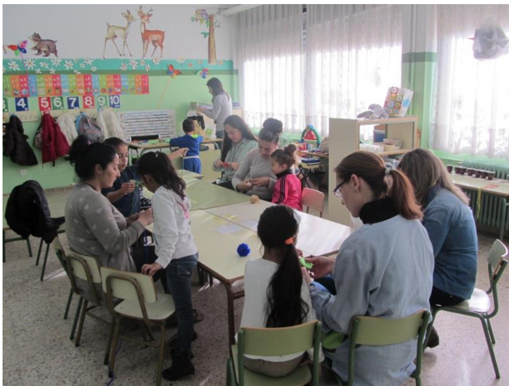
Figura 2. Familias participando en las actividades propuestas

Una vez finalizada la realización del pompón más grande despedimos a los padres y madres con una canción.