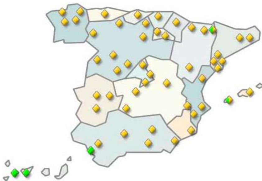
Figura 18: Patrimonio Nacional repartido por el territorio español (En verde, Patrimonio Natural. En amarillo, Patrimonio Cultural).