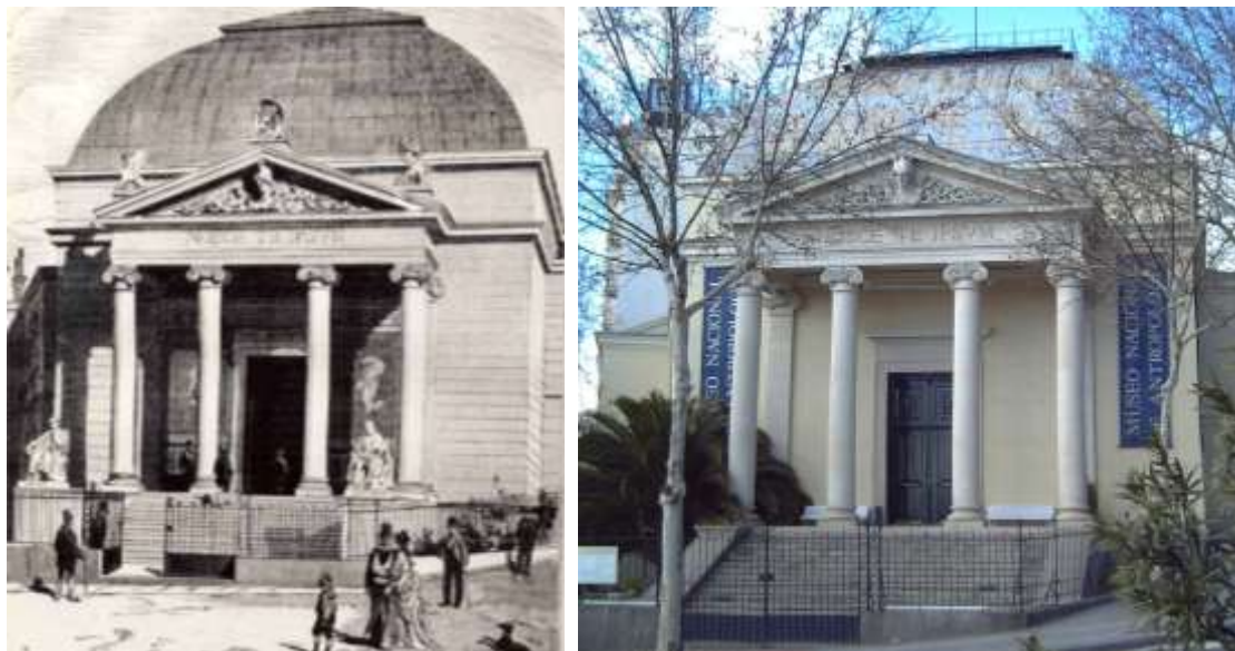
Figura 4: Vista de la fachada principal del Museo en sus orígenes y en la actualidad

Fue concebido como un templo en honor a la ciencia, lo que justifica la imagen neogriega con elementos romanos que el arquitecto quiso otorgarle.