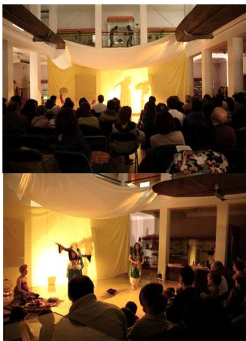
Figura 10: Espectáculo de danzas

A lo largo del año, hay muchas exposiciones temporales sobre temas muy variados, muchas de ellas destinadas o adaptadas a colegios, como exposiciones fotográficas, lenguas del mundo, música y danzas del mundo, jornadas de cocina oriental, las noches del museo (visitas guiadas jugando con las sombras, bailes de Mali), títeres del planeta tierra, juegos de pistas y gymkanas, o jornadas de charlas y debates. Las visitas escolares se hacen de martes a viernes, mediante inscripción previa, y con diferentes recursos, juegos e itinerarios según la edad de los visitantes. En estas visitas, se hacen muchas manualidades (ej.: calzado con materiales reciclados), recorridos temáticos (ej.: indios y vaqueros) y evaluación de la visita (dibuja tu experiencia en el Museo o qué es lo que más te ha gustado).