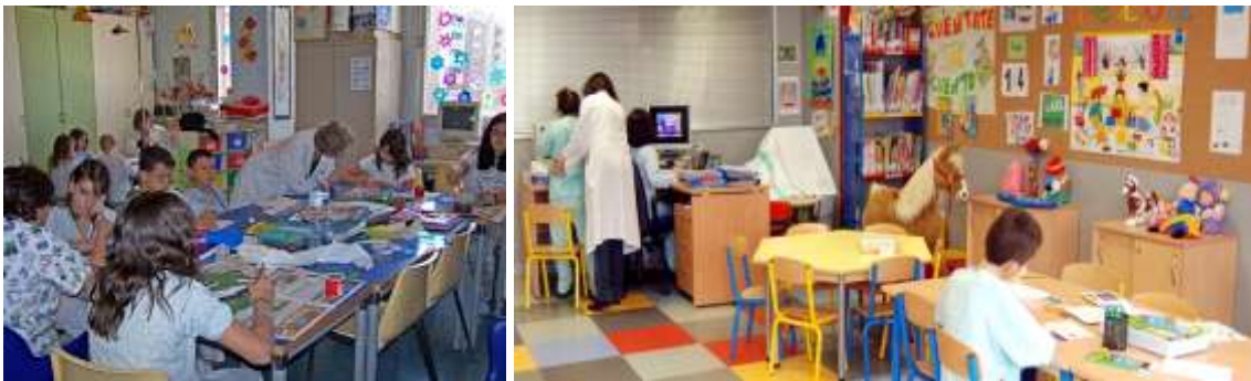
Figura 14: Aulas Hospitalarias de Móstoles y de Ciudad Real

Son muchos los hospitales españoles que cuentan con un Aula Hospitalaria, con líneas de trabajo similares entre ellas. Las comunidades autónomas en las que podemos encontrarlos son Andalucía, Asturias, Castilla y León, Castilla la Mancha, Cataluña, Extremadura, Galicia, La Rioja, Madrid, Murcia y País Vasco. En el listado que se encuentra en el Anexo IV, se encuentran los Hospitales que, a día de hoy, tienen un Aula Hospitalaria en su recinto 21 .