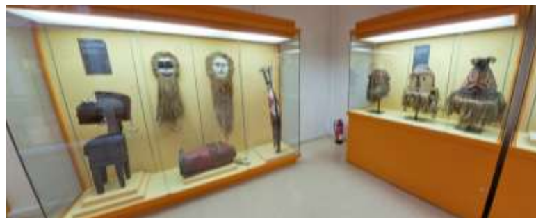
Figura 8: Sala de África. Máscaras de la República Democrática del Congo y de Guinea Ecuatorial

- África: recopilación de objetos, enseres, ajuar y esculturas que representan la variedad de culturas africanas, desde la bereber hasta la subsahariana. Hay muchos trajes típicos de tribus de Costa de Marfil, armas y herramientas zulús, diademas marroquíes, platos y recipientes hechos de bambú y calabazas de Guinea Ecuatorial o máscaras de las tribus centroafricanas.