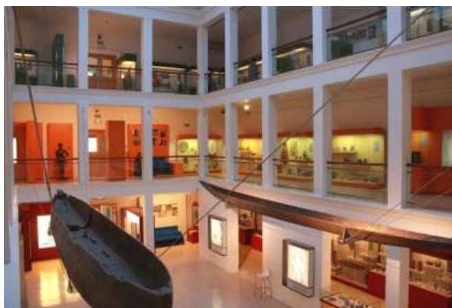
Figura 3: Vista de las salas del MNA 11