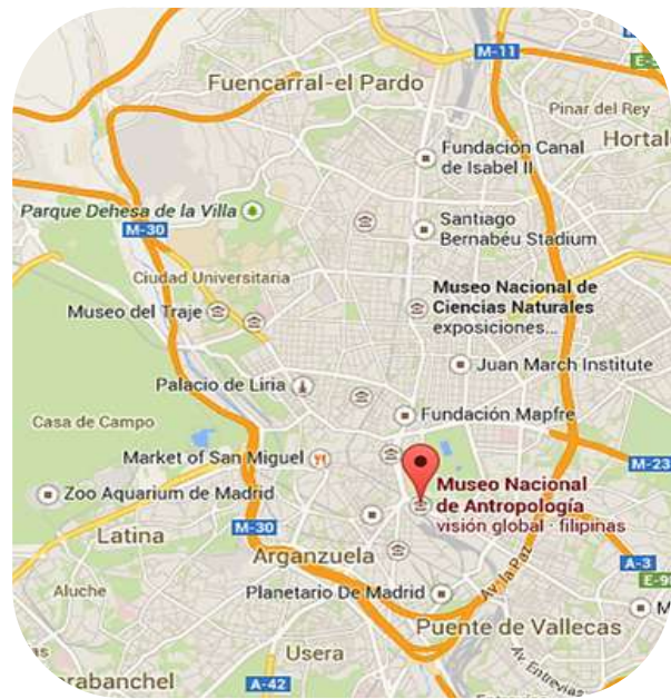
Figura 20: Mapa de Madrid y localización del MNA