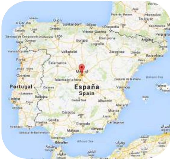
Figura 19: Localización del MNA en España