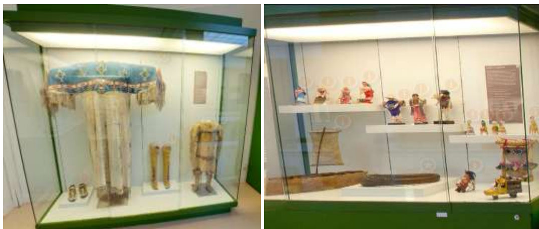
Figura 9: Sala de América. Vestidos Sioux y juguetes de las tribus del Amazonas y de Méjico

Todo este recorrido del Museo, lo podemos ver a través de la Visita Virtual del Museo Nacional de Antropología 15 , la cual nos muestra el interior de todas las salas y nos da información sobre cada una de las piezas expuestas. La visita virtual de los museos es muy interesante, puesto que los niños pueden ver y hacerse una idea de cómo es un museo, cómo se exponen las piezas, etc. en la Visita Virtual solo encontramos la exposición permanente, no las exposiciones temporales que se ofrecen a lo largo del año.