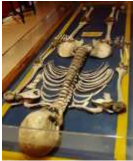
Figura 6: Esqueleto de Agustín Luengo

- Asia: objetos culturales de todo el continente asiático, con especial atención en la cultura filipina, a la que se dedica una sala completa.