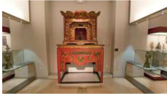
Figura 7: Sala de Asia. Altar domestico de China