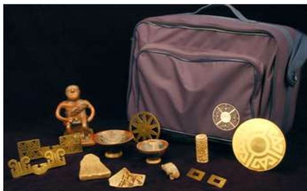
Figura 12: Ejemplo de una Maleta Didáctica, del Museo del Oro de Barranquilla, Colombia 17

Un proyecto parecido a éste se lleva años desarrollando en las escuelas de Sudamérica, donde las situaciones económicas y geográficas impiden a muchos colegios llevar a sus alumnos a un museo. Por esta razón, muchos museos estatales de Venezuela, Argentina y Colombia, tienen el programa Museos de Aula, y ofrecen las llamadas “Maletas Didácticas”, que son pequeñas exposiciones con fragmentos arqueológicos originales de cerámica, hueso, piedra o concha que tienen de 500 a 2.000 años de antigüedad y réplicas de piezas de orfebrería y cerámica precolombina, que sí se pueden tocar. Cada maleta va acompañada por una cartilla para el profesor que explica los objetivos y temáticas, sugiere múltiples actividades para hacer con los estudiantes y provee lecturas que profundizan en el tema. Varias de ellas llevan además una guía didáctica o un juego de mesa para los alumnos (Armengol Díaz, 2000).