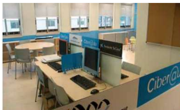
Figura 15: Ciber@aula de Vigo

Algunos hospitales españoles, como es el caso del Complejo Universitario de Vigo, disponen de un Ciber@ula Hospitalaria, para que los niños ingresados puedan formarse y hacer uso de las nuevas tecnologías.