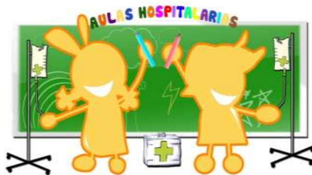
Figura 13: Logotipo de las Aulas Hospitalarias

Al igual que el traslado de un museo a un aula, en el cual lo que estamos realizando es cambiar el lugar físico donde se desarrollan las exposiciones, podemos llevar el aula a cualquier espacio que sea necesario, como es el caso de las ya creadas Aulas Hospitalarias, que son las unidades escolares surgidas dentro del hospital, con el objetivo principal de atender escolarmente a los niños hospitalizados, al mismo tiempo que se ayuda a prevenir y evitar la posible marginación que, por causa de una enfermedad, puede sufrir el niño por causa de esta hospitalización. Se trata de una propuesta didáctica dirigida a los profesionales del ámbito educativo y escolar hospitalario que, mediante la utilización de diversos recursos, presenta información, documentación e instrumentos útiles y necesarios para la atención escolar del alumnado hospitalizado y convaleciente en su domicilio 19 .