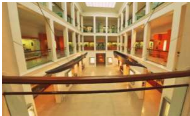
Figura 5: Vista del MNA. Se puede observar la planta 1, las barcas de Filipinas, los pasillos de la planta 2 y 3.

El Museo Nacional de Antropología se divide en tres plantas, en las cuales se exponen los objetos e información acerca de las diferentes culturas que trabaja. En la planta baja, al entrar, hay un gran espacio libre, donde se realizan actividades infantiles o representaciones, y es el lugar desde el cual se ven todas las plantas del museo.