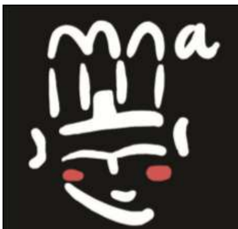
Figura 2: Logotipo del Museo Nacional de Antropología

El Museo Nacional de Antropología, o MNA, es una institución inaugurada en 1875 por el rey Alfonso XII, dedicada a ofrecer una visión global de distintas culturas del planeta, con exposiciones que recogen colecciones de los cinco continentes. Está situado en Madrid y se encuentra en la Red de Museos Estatales comentada anteriormente. El Museo Nacional de Antropología, es el primer museo de carácter antropológico que se crea en España. Ofrece al público una visión global de la cultura de diferentes pueblos del mundo y establece las semejanzas y diferencias culturales que les unen o separan para poner de manifiesto la diversidad cultural. Las colecciones que a lo largo del tiempo se han ido incorporando son muestras de la cultura material de diferentes pueblos de África, América, Asia, Europa y Oceanía.