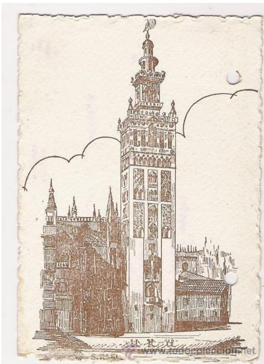
LA GIRALDA DE SEVILLA- DIBUJO A PLUMA SALVADOR RAEI