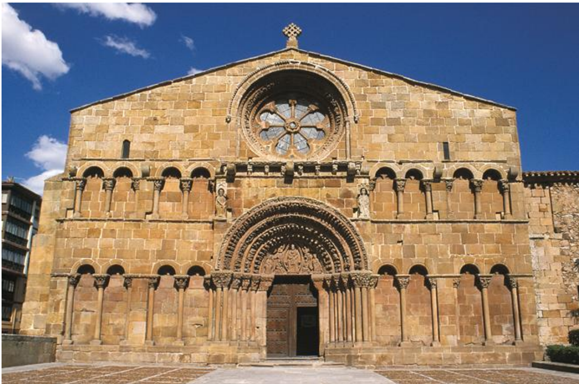
Iglesia de Santo Domingo

Las estructuras arquitectónicas como iglesias, catedrales, mercados, pueblos, ciudades... Tal fue ésta una de las formas de diferenciarse de los musulmanes y de los judíos que comenzaron a construir iglesias en todas las ciudades y aquellas con mayor importancia Catedrales de grandes dimensiones que simbolizaban la presencia de la cultura cristiana en ese lugar. Un ejemplo de iglesia podría ser la iglesia de Santo Domingo en la ciudad de Soria (antigua iglesia de Santo Tomé) del S.XII. Una catedral importante de esta época fue la catedral de Santa María de Burgos que comenzó a construirse en el año 1221.