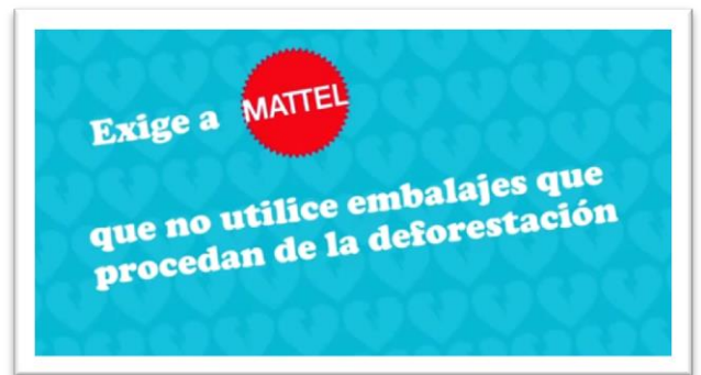
Imágenes 12 y 13 – Secuencias de la pieza audiovisual emitida por Greenpeace.

-Vallas publicitarias, carteles, lonas, folletos informativos, etc: En los diferentes países, en las diferentes sedes de Mattel, y en forma de carteles para apoyar las acciones de street marketing, se desplegaron lonas como la imagen que se muestra a continuación, donde aparece Ken (enfadado), anunciando que él no sale con chicas que deforestan, y el claim “Las cajas de juguetes de Mattel destruyen la selva tropical”.