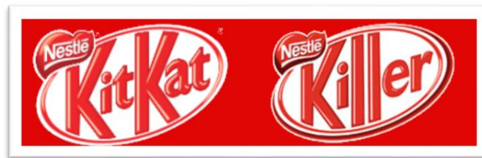
Imagen 2 – Cambio de logotipo de “KitKat” por “Killer”.

Lanzaron una campaña en la que modificaron el logotipo de Kit-Kat por la palabra “killer” (asesino), y lo utilizaron en las diferentes piezas de comunicación: