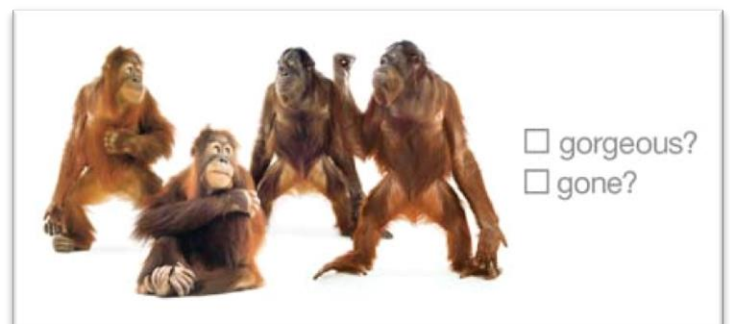
Imágenes 19 y 20 – Comparación de la campaña de Dove y la contrapublicidad de Greenpeace.

-Acciones de Street marketing: Alrededor de las sedes de Unilever, marca que posee a Dove, los activistas de Greenpeace se disfrazaron de orangutanes, como en numerosas ocasiones, los cuales sostenían lonas y carteles en los que acusaban a Dove de la destrucción de su hábitat por la utilización del aceite de palma en sus productos.