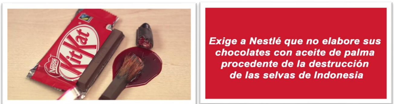
Imágenes 3 y 4 – Secuencias de la pieza visual.

Lanzada desde Youtube a las diferentes redes sociales, donde se simula un spot de Kit-Kat , en el que se invita a los usuarios a que se den un respiro, pero este finaliza con el claim “Exígele a Nestlé que deje de comprar aceite de palma de empresas que destruyen los bosques.”