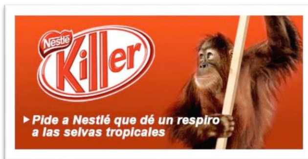
Imagen 5 – Página de inicio de la web.

-Sitio web: Crearon la página web www.greenpeace.org/kitkat (no disponible actualmente), donde en la página de inicio aparecía un orangután en peligro de extinción, y la opción de “clicar” sobre “Pide a Nestlé que dé un respiro a las selvas tropicales”, donde se accedía a la pieza audiovisual creada por Greenpeace, contenido sobre el aceite de palma y su denuncia, y una solicitud de firma para presentar ante Nestlé, para retirar el uso de aceite de palma en sus productos.