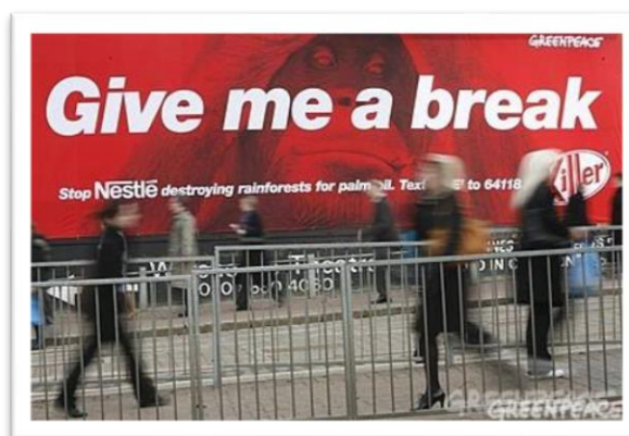
Imágenes 6 y 7 – Lona desplegable y valla publicitaria en las sedes de Nestlé- Fuentes: Realitysandwich.com y Spot.guerrilla.com

-Acciones de street marketing: A la hora de manifestarse y convocar a los medios, los activistas se disfrazaron de orangutanes, sosteniendo pancartas con el claim utilizado durante toda la campaña, se tendieron en el suelo como símbolo de sufrimiento, y se metieron en cajas, en forma de packaging de Kit-Kat. Todo un espectáculo y un gran despliegue de ingenio y misma línea comunicativa.