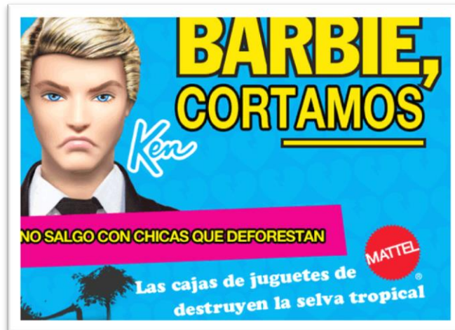
Imagen 14 – Imagen de las lonas y carteles creados para apoyar la acción de Greenpeace.