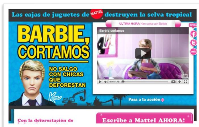
Imagen 10 – Página de inicio de la web.

-Sitio web: Se creó la web www.greenpeace.org/espana/barbie donde se invitaba a los usuarios a ver la pieza visual y escribir a Mattel, haciéndoles llegar sus quejas, por la utilización de papel y pasta de papel, procedente de selvas tropicales de Indonesia, para el embalaje de la muñeca Barbie.