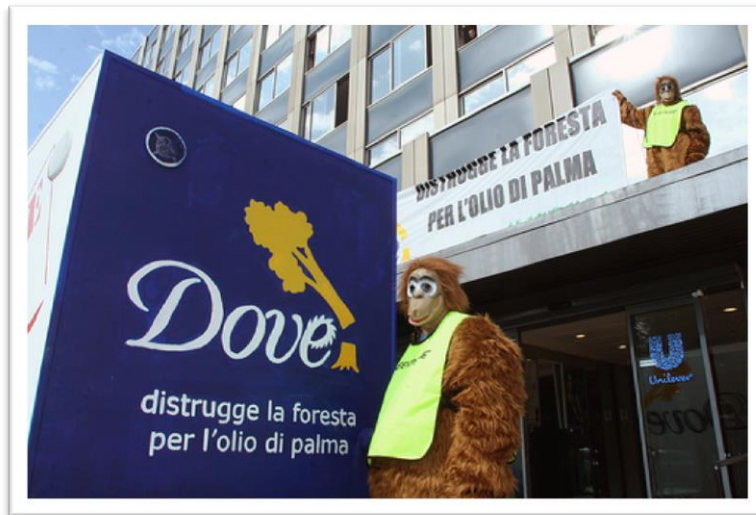
Imagen 21 – Activistas de Greenpeace disfrazados de orangutanes, manifestándose frente a la sede de Unilever.