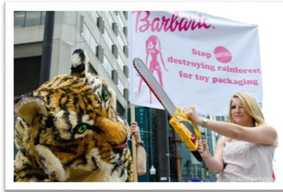
Imagen 11 – Acción de marketing Street donde se simula el asesinato de una Barbie hacia un tigre de Sumatra.