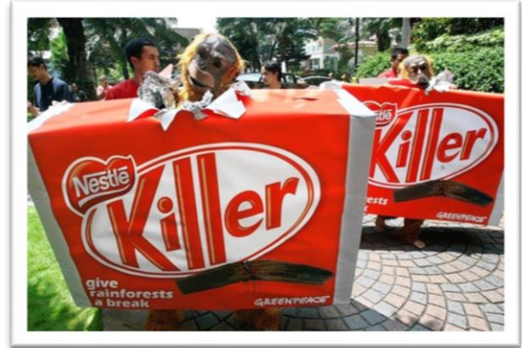
Imágenes 8 y 9 – Hombres disfrazados de orangutanes y cajas “Killer” simulando el packaging de “KitKat”.