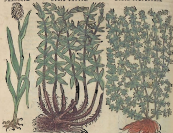
De la Phalaride.