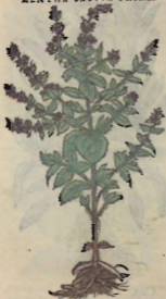
De la yerua buena.