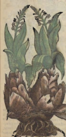
S C I L L A.

LA Scila tiene virtud aguda, & hiriente, y sirve para infinitas cosas asada. Empero para q̄ se use mejor, la cubren de masa, ò de barro, y cubierta la meten en el horno, ò la ponen debajo de la brasa, hasta que la pasta perfectamente se tueste: la qual quitada, si la cebolla no se mostrare tierna, emboltrase otra vez en otra masa, ò barro reciente, y tostarse de nuevo: porque la que no se asá desta manera, es muy dañosa à los interiores miembros.