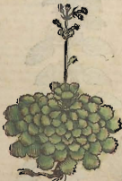
Del Ombligo de Venus.