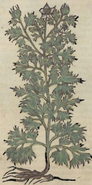
De la Nigela.