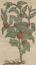
Del Solano hortense.