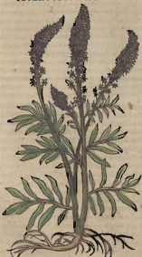
Del Sesamoide mayor.