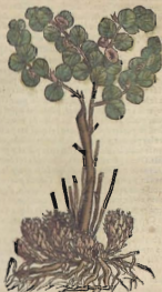
De la Hypocistide.