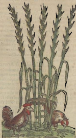
Cap. X C.

EL Alegria es d'utofo al estomago, y engendra cierta hidiondez de boca, si se queda entre los dientes quando se come. Aplicada en forma d'emplastro, reluelue los humores cògelados sobre los nervios, y sana las contusiones y apòstemas de los oydos, las quemaduras del fuego, los dolores de ijada, y la mordedora de la Cerafa. Mezclada con azeite còsado, mitiga el dolor de cabeza causado del encandimiento del Sol. La planta corida en vino, sirve a las mesmas cosas, y particularmente es vtil contra las inflamaciones y dolores grauissimos de los ojos. Ha refi de la fiente en azeite, del qual los Egyptios vsan.