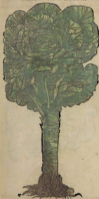
De las Verças.