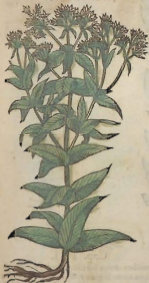
De la Lysimachia .