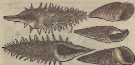
De la Purpura, y de la Bozina.