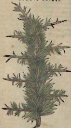
Cap. XC VII.

L A Erica es vn arbol ramoso, así como el Tamarisco, aun que harto menor. Reproducese tambien engendrada de las abejas que pacieron su flor. La cima juntamente y la flor d' esta planta, puesta en forma d'emplastro, sana las mordeduras de las serpientes.