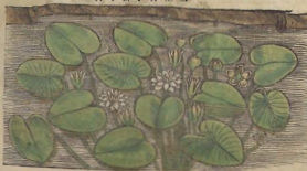
De la Nymphaea.