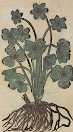
De la Epipactide.