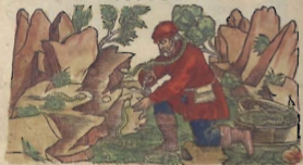
De la Biuora.