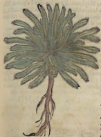
N Y M P H E A.

De la Onosma. Cap. CXL I. L A Onosma produce las hojas semejantes à las de la Ancusa, tiernas, luengas de quatro dedos, anchas de vno, desparzidas por tierra, sin tallo, sin fruto, y sin flor. Tiene vna rayza pequeña, ilaca, subtil, lnguezilla, y roxa. Nace en escabrosos lugares. Beoidas sus hojas con vino, arrancan la enatura del vientre. Dicele que si vna preñada passare por encima de aquella yerua, luego malparirà.