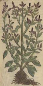
De los Bledos.