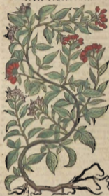
De la Vid salvaje.