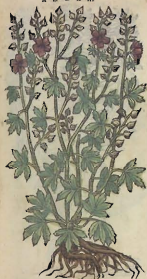
Del Cañamo domestico.