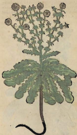
De la Condrita.