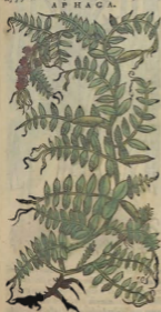
De la Aphaca.

Alfa . Fr. Foin de Bourgogne . Tod. Medicâ braun . L Ayena Idélica se llamó así, por haver venido primeramente à Italia, de la región de Media. Fue siempre destinada esta planta à la pastura de toda especie de bestias. Hallase antiguamente gran copia della por toda la Europa: mas agora no se halla tan copiosa como en España. Llamanla los Arabes Alfifol , delante de qual vino à llamarse en algunas partes Alfalfa .