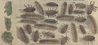
Delos Cith. Griego, Nardus, J. L. Cantharides, Ar. Canthar. Cast. Abadon. Por. Moscas de seisio. H. Cantar. De los Buprestes. Ge. Buprest. La. Buprestes. Ar. Xopholis. Cast. Mata bucy. Cat. Mosca de asẽ. Por. Vauloura.

CANTHARIDES, BUPRESTES, ET PINORVM ERUCAE.