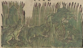
De las Ranas.