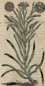
De la Barba Cabruna.