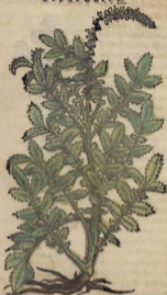
Origo, et arbor. Lat. Elatine. Ara. Achin.

A Leguas por la Elatine tomá la llamada vulgarmente yedra terrestre, y no sin error manifiesto, por elida q̄ la yedra terrestre es amarga, y vn poco aguda, de da cōsta q̄ su facultad es calidit̄; y la Elatine manifestolamente aprita y resista. Hallase la legitima Elatine quasi por toda la Francia, qual aqui nos la pinta Dioscorides.