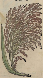
Aa Del Mijo.