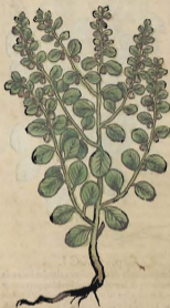
Del Heliotropio menor.