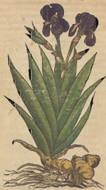
De la Iris.