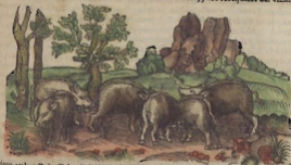
Criego, apud La. Talia. Gall. Carnicol. Ita. Talia de puerco.

EL carnicol del Puerco quemado, hasta que de negro se torne blanco, y despues molió y beuido, cura las venosidades del intestino llamado colo, y los torcijones del vientro.