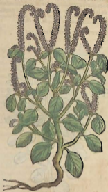
Cap. CXC I.

LA Cynocrambe produce vn tallico tierno, blanquezino, y de dos palmos alto; las hojas de medio à trescho, como las de la Mercurial, ó como las de la yedra, tambien blanquezinas; y diuiso pequeño, redondo, y apegado à las hojas. Beuidos sus tallos y hojas, tienen virtud de purgar el vientre: y guisante como la otra hortaliza. El caldo de aquesta planta cozida en agua, purga la colera, y los humores aquosos.