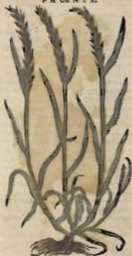
De la Rayz Idea.