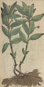
De la Cynocrambe.