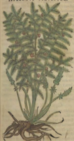
De los Esparragos.