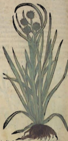
Del Xiphio, llamado en Latin Gladiolo. Cap. XXII.

E L Xiphio se llamó así, porque sus hojas tienen forma d'espada: las quales se parecen mucho à la Iride, salvo que son menores, mas angostas, apuntadas en manera de estoque, y llenas de nervios. Produce el tallo de vn codo, adornado de ciertas flores purpuras, distantes unas de otras, y puestas por gentil ordenança. Su simiente es redonda. Tiene dos rayzes vna sobre otra, como bulbos pequeños: de las quales la inferior es pequeña, y delgada: y la superior mas crecida, y mas llena. Nace por la mayor parte en los campos labrados. La mas alta aplica da con encienno, y con vino, saca fuera del cuerpo los caquillos, y las espinas: y si se aplica con aguamiel, y con harina de Lollo, tiene fuerza de resolver los diuicilos: pordonde la suelen mezclar cõ semejantes emplastros. Puesta en la natura de la muger, atrahe el menstua. Dize se que aquesta bebida con vino, incita mucho à luxuria: y que la otra que està mas baxa, haze los hombres esteriles. Dize se mas, q̃ la superior se da vtilmente à beuer cõ agua à los niños que de budo,