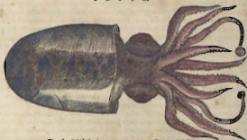
De la Xibia.