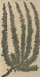
De la Erica.