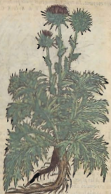
Giogo, ideo, y trinis. La Anonis y Ononis. Rtr. Rella Bouis, y Komora arazi. Call. Deciese booz. It. Bonaga. NOMBRES

O Nos quiere decir asno en Griego: del qual nombre vino à llamarse esta planta Ononide, porque las asnas para rascarse, como no tengan quien les haga san buca obra suelen revolcarse sobre ella, por ser espinosa y espinosa. Quadróle tambien el tal nombre, porque la comen de buena gana las mismas de sueris. A esta planta les soue à sus Señorías, de puyre, à alimahaça, y de monda dientes. Algunos la llamaron Anonide, y esto transfundiendo por yerro una letra en otra. Llamase ordinariamente entre los herbolarios Rella bouis, y Komora arazi, que quiere decir detenedora de los buyes, y del arado, porque suele nacer por la heredades, y no ay planta que mas haga renegar à los labradores, enlazandoles los pies, y el arado. Dize Plinio que la Ononide produce las hojas semejantes à aquellas de las albulinas: y Dioscorides, que las hayamos las del Loto pratense: de donde puede el hombre conjeturar, que las albulinas y el Loto pratense son una misma planta, à lo menos muy semejantes. La raíz de la Ononide, es caliente en el grado tercero. Su corteza tiene virtud de mundificar y adolaxer los gruesos humores. Cocida con aguamiel, se dà simplicemente à beber, contra la gaza coral.