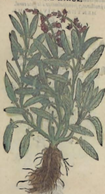
De la Salvia.