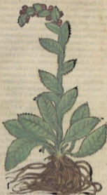
De la Bacara.