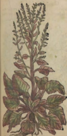
De las Acelgas.