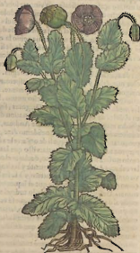
Del Papauer domestico.