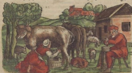
De la Leche.