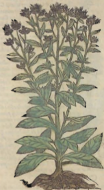
De la Coniza