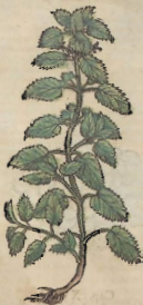
De la Hortiga.