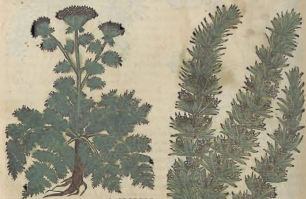
Del Romero. Cap. LXXXI.

D El Romero ay dos eſpecies: vna fructifera y otra eſteril. El fruto de aſſa fe llama Cachrys. Sus hojas fon como las del hinojo, epero mas anchas, mas gruesas, y de fuete olor: las quales fe derraman por tierra, y hazen como vna rueda. Su tallo es alto de vn codo, y aun algo mayor, y deſpar ramado con muchas alas: el qual haze encima vna copa, y en ella mucha ſimiente blanca, redonda, eſquinada, aguda, refinosa, y algo ſemiente à aqueſta del Sphondylion: la qual maxcada abraſa la lengua. Produce la rayz blanca, grande, olorosa, y negra, aſi como el Sphondylion, empero nada hiriente. Su rayz por de fuera es negra, y rompiendose, por de dentro ſe muestra blanca. La llamada eſteril, del todo es ſemiente à las dichas, ſi uo quem produce tallo, ni flor, ni ſimiente. Nace aqueſta en hogares y pedregales y aſomos. M ajadas las hojas de cada vna dellas, y aplicadas en forma d'empixtro, refuſen à eſtufion de las amorranas, aligan las inflamaciones, y emientias del hieſto, y m aſtan los lampas-