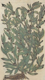
Del Polygono macho.