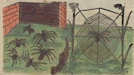
Grego. Ar. La. Araneus. Ar. Mandibul. Car. Car. Por. Araña. It. Ragno. Fr. Araigne. Tod. Spid.

na. Su tela aplicada, refriete las effluuiones de sangre, y defiende que las heridas superficiales no se apoflomen. Ay otra especie de Araña, la qual teze vna tela blanca, subtil, y fuertemente tapida. Esta pues atada en vn valdres, y alida al braço, dizen que quita las accelliones de la quarta. Frita en azeyte rosado, &c. infulada en los eydos que duelen, alivia el dolor.