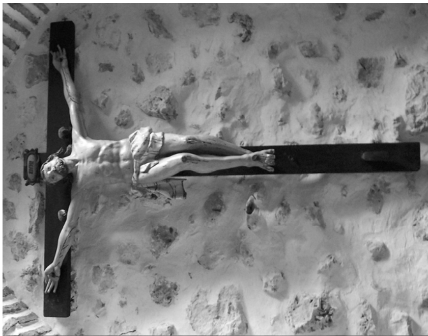
Fig. 4. Santibáñez de Valcorba. Iglesia Parroquial. Crucificado procedente del humilladero, hoy junto a la pila bautismal.