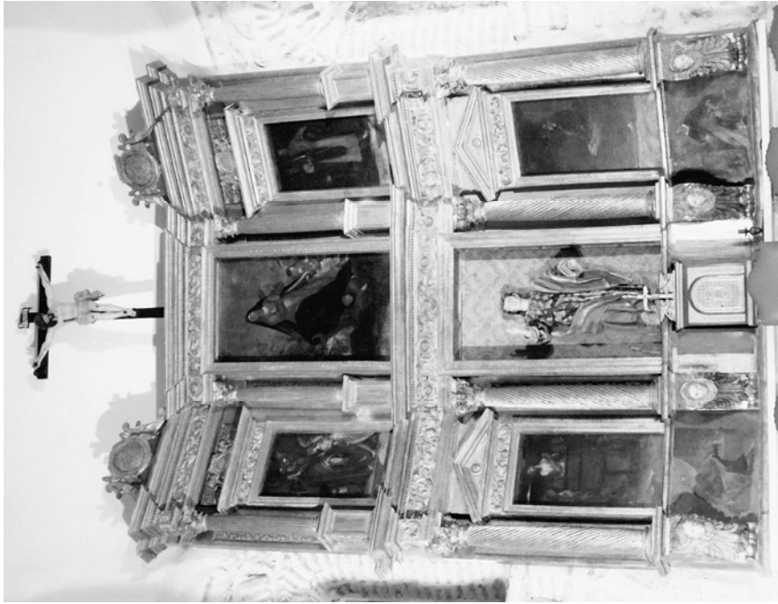
Fig. 2. Santibáñez de Valcorba. Iglesia Parroquial. Retablo mayor. Alonso de Herrera (pintura) y Roque Muñoz (ensamblaje). 1617.