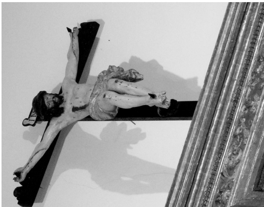
Fig. 3. Santibáñez de Valcorba. Iglesia Parroquial. Detalle del Crucificado en el ático del retablo.