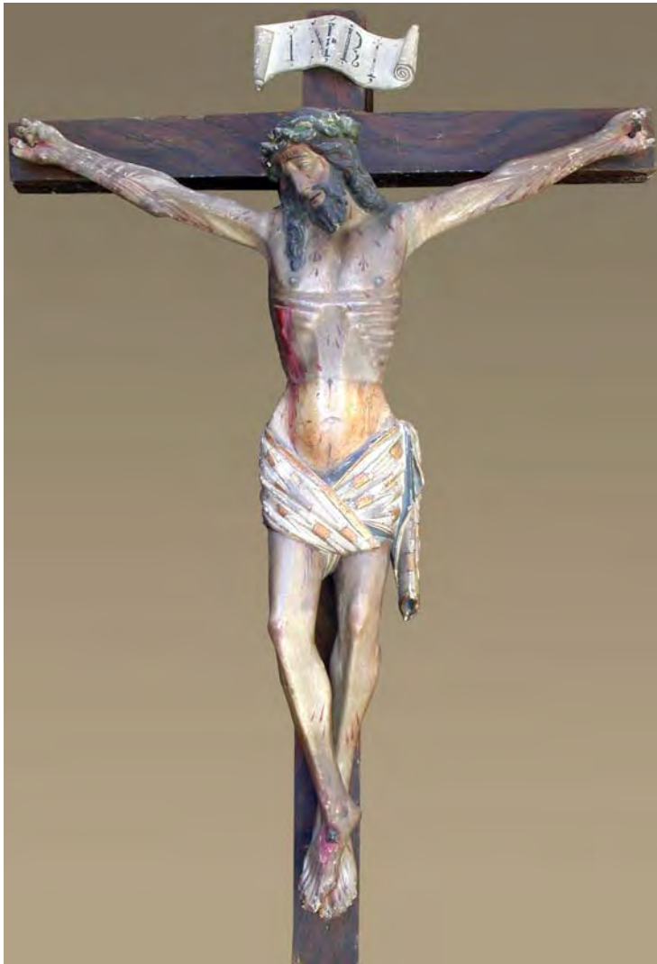
Fig. 1. Cristo crucificado . Centro parroquial. Villafáfila (Zamora).

San Andrés 4 , donde, como imagen titular y devocional, quizás ocupase la hornacina de su retablo mayor. Tampoco sabemos si originalmente formaba un Calvario con las figuras de la Virgen Dolorosa y San Juan Evangelista, pero creemos que se trataba de una figura aislada, como parece ser lo habitual en la producción de este escultor.