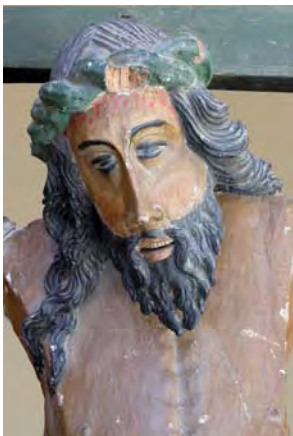
Fig. 5. Detalle de fig. 4.