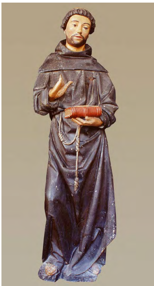
Fig. 7. San Antonio de Padua . Convento de Santa Marina (Clarisas). Zamora.

Finalmente, el Convento de Santa Marina (Clarisas) de la ciudad de Zamora posee en su clausura una imagen de San Antonio de Padua (fig. 7), a la que falta el Niño Jesús original. Mide 118x36x38 cm. Está repintada y tiene mutilados los dedos de su mano derecha, excepto el pulgar.