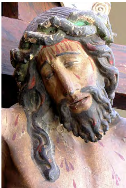
Fig. 2. Detalle de fig. 1.

Está burdamente repintado, excepto en la zona comprendida entre la cintura y la mitad de las piernas, explicable porque antiguamente debió de estar tapada por un faldellín, como era costumbre extendida en las imágenes devocionales de Cristo crucificado . El dorso es plano, no está tallado en bulto redondo. El lugar del clavo que sujetaba los pies al madero ha sido modificado, pues se ha tapado el orificio original y se ha colocado el clavo más arriba. Los dedos de las manos, en su mayoría, están mutilados, aunque su posición denota que estaban contraídos. La cruz, que mide 210x106 cm., también está repintada, imitando las vetas de la madera. Conserva la cartela original, a modo de filacteria apergaminaada.