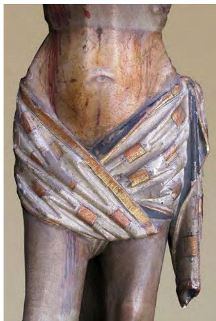
Fig. 3. Detalle de fig. 1.

La figura participa de los estilemas asignados a la obra de Alejo de Vahía. La cabeza (fig. 2), algo desproporcionada con respecto a un abultado tórax, está girada hacia su derecha y levemente inclinada hacia adelante; va ceñida por una corona formada por dos gruesas ramas de espino trenzadas, de la que ha perdido sus púas. La cabellera cae en mechones ondulados y su larga barba dibuja el esquema habitual, con ondas simétricas a cada lado y vacío bajo el labio inferior. Presenta nariz recta y pómulos salientes, y mantiene los ojos y la boca entreabiertos. El torso, modelado sumariamente, contiene los músculos pectorales aristados y las costillas resaltadas; la sangre que brota de la llaga del costado derecho desciende en leve