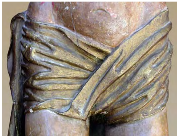
Fig. 6. Detalle de fig. 4.