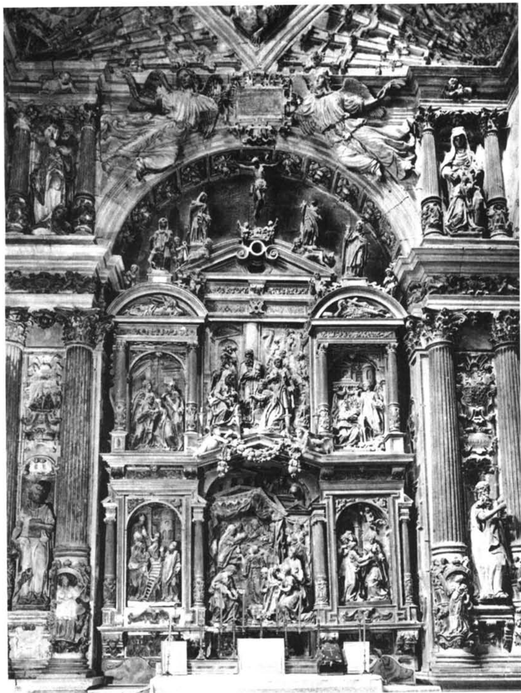
Burgos. Catedral. Capilla de la Natividad. Retablo (1585).