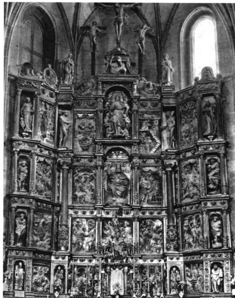
1. Alcajos (Valladolid). Iglesia de Santa María. Retablo mayor.-2. Pampliega (Burgos). Iglesia parroquial. Retablo mayor (1552).