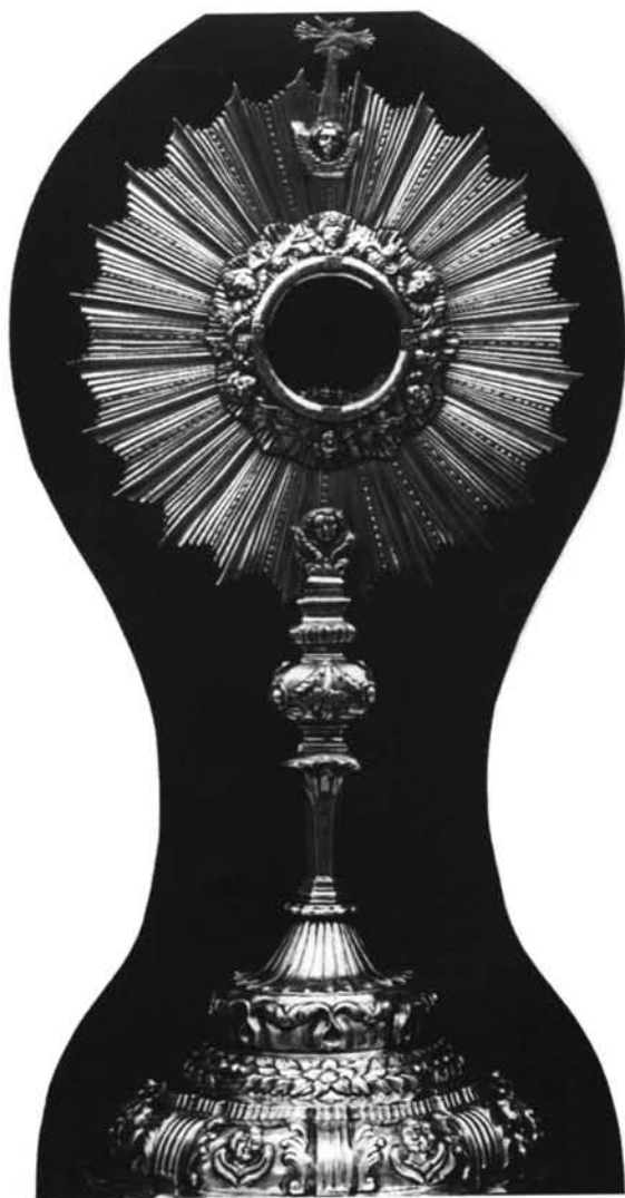
Torquemada (Palencia). Iglesia parroquial. Custodia.