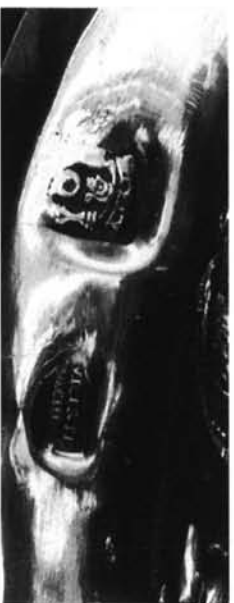
Torquemada (Palencia). Iglesia parroquial. Custodia. 1. Detalle: reverso del viril.-2. Marcas: Querétaro y Vicente Machuca.