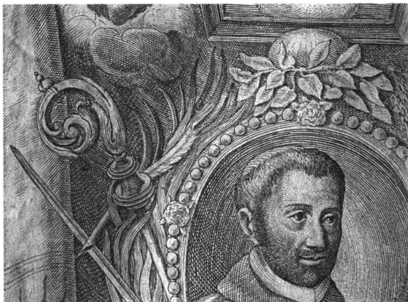
1. Retrato de Palafox, detalle de la parte superior. 2. Retrato de Palafox, detalle del lado izquierdo.