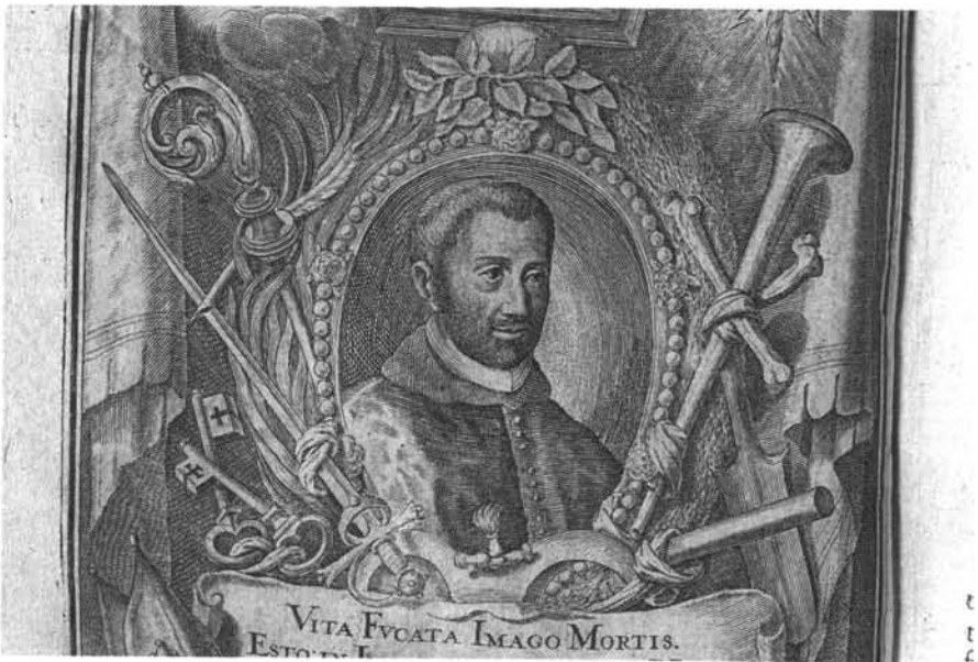
2. Retrato de Palafox, centro de la composición. 1. Retrato de Palafox, inscripción y firmas.