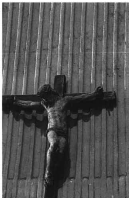
Alaejos (Valladolid). 1 y 2: Retablo lateral de la iglesia de San Pedro. 3: Crucifijo de la iglesia de Santa María, por Esteban Jordán.