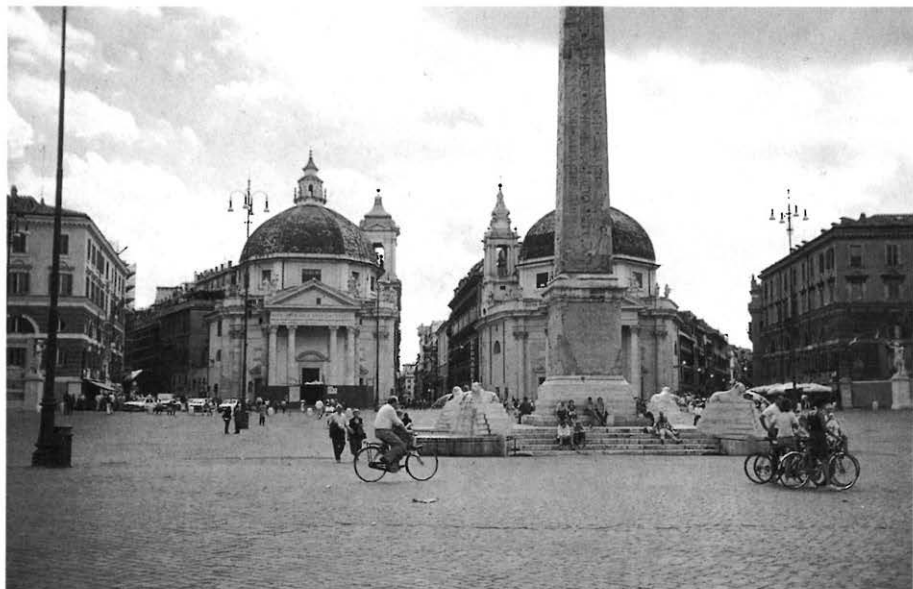
PIAZZA DEL POPOLO RESTAURATA E SENZA VETTURE