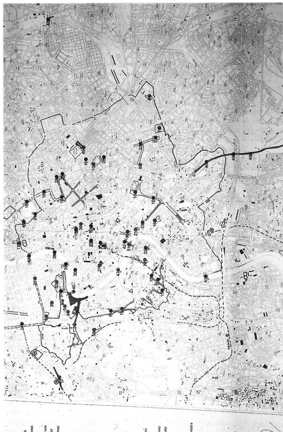
GLI INTERVENTI NEL CENTRO STORICO PER IL GIUBILEO 2000.