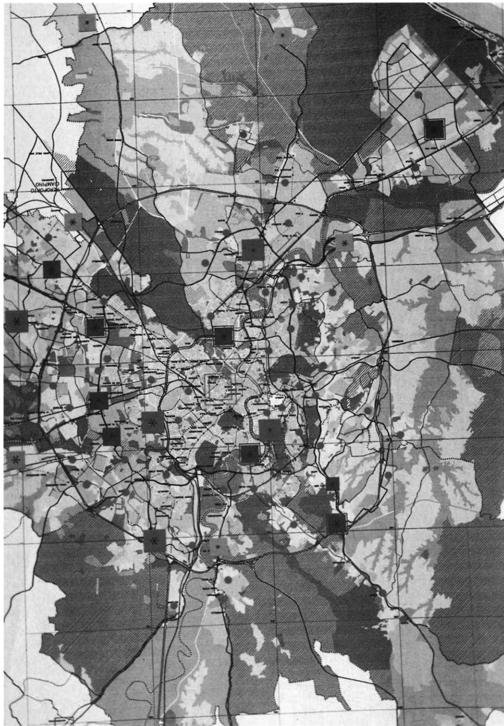
LE CENTRALITÀ NEL NUOVO PIANO DI ROMA