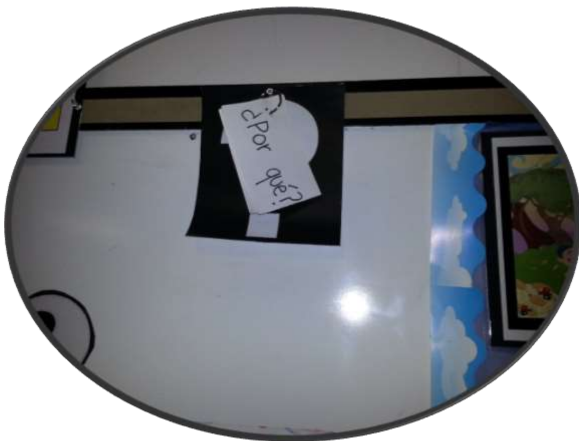
Imagen referente a las preguntas de un enfoque constructivista