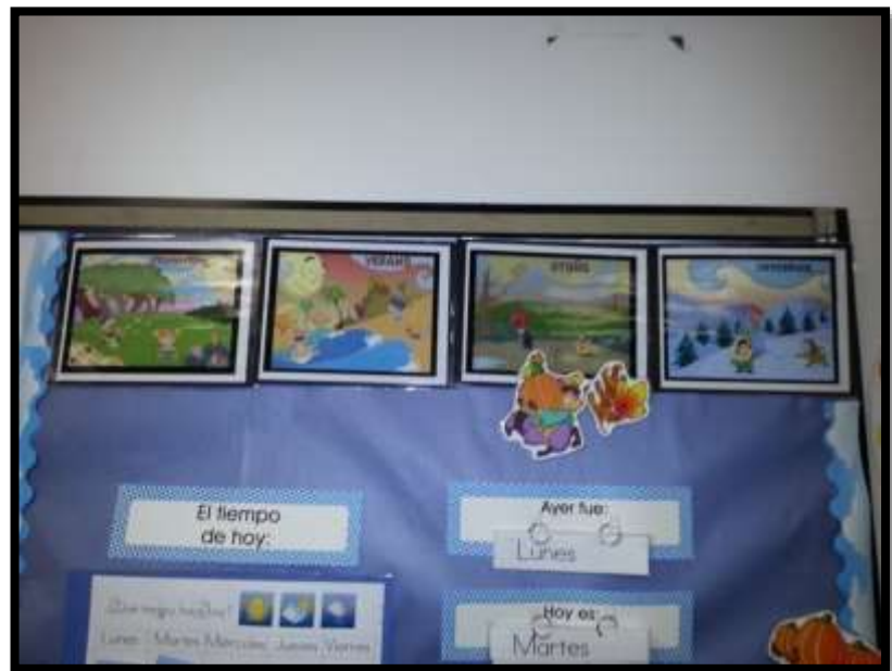
RINCÓN DEL TIEMPO