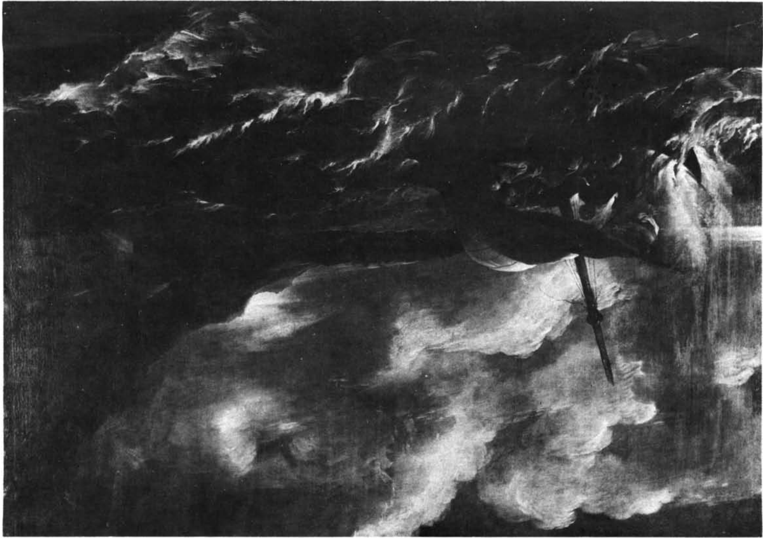
Sevilla. Propiedad particular. Vocación de los hijos de Zebedeo, por el Caballero Tempesta.