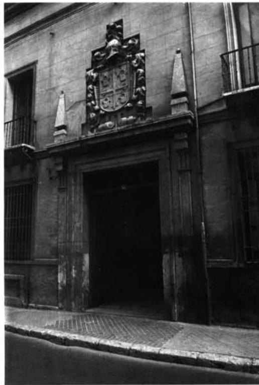
1. Portada de la casa número 14 de la calle de San Martín.—2. Casa accesoria a la del Caballo de Troya en la calle del Correo.—3. Portada de la casa del licenciado Hernando de Villagómez, en la calle Fray Luis de León.