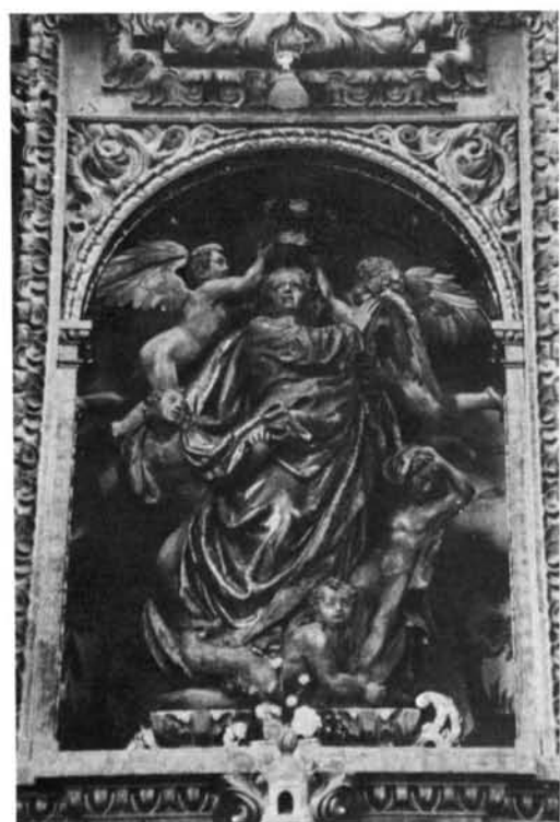
Villahizán de Treviño (Burgos). Iglesia parroquial: 1, 2, 3 y 4. Conjunto y detalles del retablo mayor.