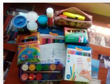
Ilustración 3: Material lúdico del aula.

naturaleza que nos rodean, empleados como recurso pedagógico que facilitan el proceso de enseñanza-aprendizaje del alumnado en base a la educación patrimonial; y por último, los utensilios, soportes y materiales fungibles que se utilizan en el aula, y en el centro en general, destacando el material artístico (tijeras, pinturas, pegamento, papel,...) y el material adicional (bolsas de basura, telas, etc.) que ayudan a que el niño/a desarrolle mejor sus habilidades plásticas y fomente al mismo tiempo, su creatividad.