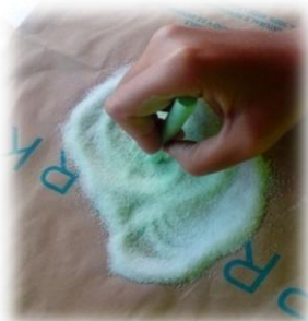
Ilustración 9: Ejemplo de mezcla de sal gorda y tiza.

En primer lugar, esta actividad se lleva a cabo con el fin de interpretar el patrimonio paisajístico de la ciudad. Por lo tanto, tras haber realizado una ruta por los