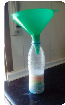
Ilustración 10: Ejemplo de botella de mil colores.

Por lo tanto, la actividad consiste en que los niños/as mezclarán en las bolsitas de plástico, la sal gorda y la tiza de color, frotando ésta en la sal para teñirla. Asimismo, podrán hacer más bolsitas de sal de colores, hasta agotar éstas. Una vez que hayan terminado las mezclas, cogerán su botella y de manera libre y creativa irán insertando la sal de colores en ésta con ayuda de un