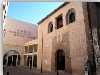
Ilustración 8: Museo “Esteban Vicente” (Segovia).

En esta actividad, los alumnos y alumnas visitarán el museo “Esteban Vicente”, en el que observarán y analizarán sobre una galería de obras artísticas sobre el color y sus propiedades. Una vez finalizada la visita, realizarán el taller que expone el