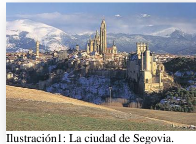
Ilustración1: La ciudad de Segovia.

Por otro lado, dicho trabajo está formado por cinco capítulos fundamentales. En primer lugar, se diseñan unos objetivos como guía principal de nuestro trabajo, así como la argumentación de la justificación del tema a trabajar. Posteriormente, se redacta un marco teórico basado en la bibliografía más influyente sobre el patrimonio y el vínculo que mantiene éste con la Educación Infantil (experiencias, currículum). A continuación, se introduce la metodología primordial para llevar a cabo esta temática en las programaciones educativas infantiles, seguida de una propuesta didáctica de mejora para proporcionar una herramienta útil y pretender así, aproximar el patrimonio a la comunidad educativa. Por último, se plantean las reflexiones, conclusiones y resultados que se han conseguido con la elaboración de dicho trabajo y las hipótesis o suposiciones establecidas en su elaboración, debido a que no ha podido llevarse a la práctica la propuesta diseñada.