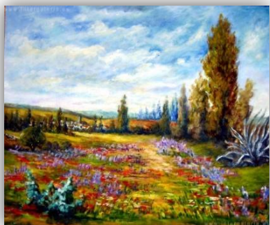
Ilustración 7: Los colores de la primavera de Remigio Megías.

En primer lugar, los niños y niñas se colocan en la alfombra para dar comienzo a la asamblea. En ésta, la docente explicará el concepto que vamos a trabajar a lo largo de la semana, el color. Después, realizará un juego con el alumnado, el cual consiste en