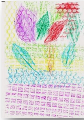
Ilustración 6: Ejemplo de las texturas del frottage.

materiales como la piedra que compone la pared, hojas, flores, monedas,... para crear diferentes texturas, en base a la textura expuesta en la pared. Con ello, se conseguirá que el alumnado experimente y reflexione acerca del efecto que crea la pintura sobre las diferentes texturas utilizadas.