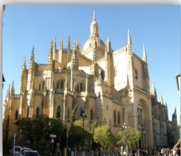
Ilustración 5: La Catedral de Segovia.

Tras el desarrollo de la actividad inicial, el primer contacto con el patrimonio de nuestra ciudad y el análisis de las diferentes texturas que nos encontramos en los diversos elementos del medio, ponemos en práctica los conocimientos previos del alumnado con una nueva actividad.