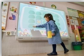
Ilustración 2: Pizarra digital interactiva.

En cuanto a los recursos materiales y el mobiliario del centro que se va a utilizar, destacamos la pizarra digital; la propia aula, como recurso físico, además de nuestra ciudad y el museo para la elaboración de varias actividades; el material básico del que debe disponer un aula, como son las mesas y las sillas, la alfombra donde se realizan las asambleas y muchas de las actividades colectivas; materiales relacionados con el entorno y la