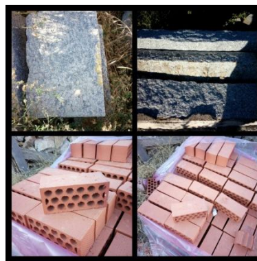
Ilustración 4: Elementos patrimoniales de la ciudad.

Después de realizar las cuestiones y conocer las ideas previas que poseen los niños/as sobre el patrimonio más característico de su ciudad, la docente enseña a éstos una serie de elementos patrimoniales procedentes de su entorno próximo (granito, caliza, pizarra, ladrillo, etc.)