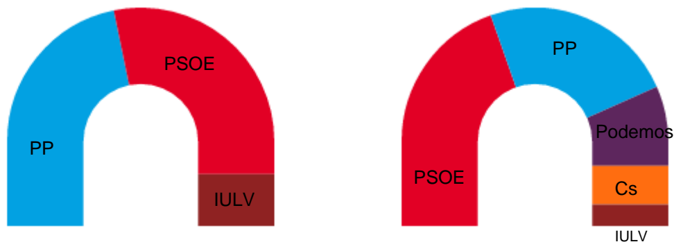
Figura 2.2.1: Reparto escaños elecciones 2012 y 2015 respectivamente