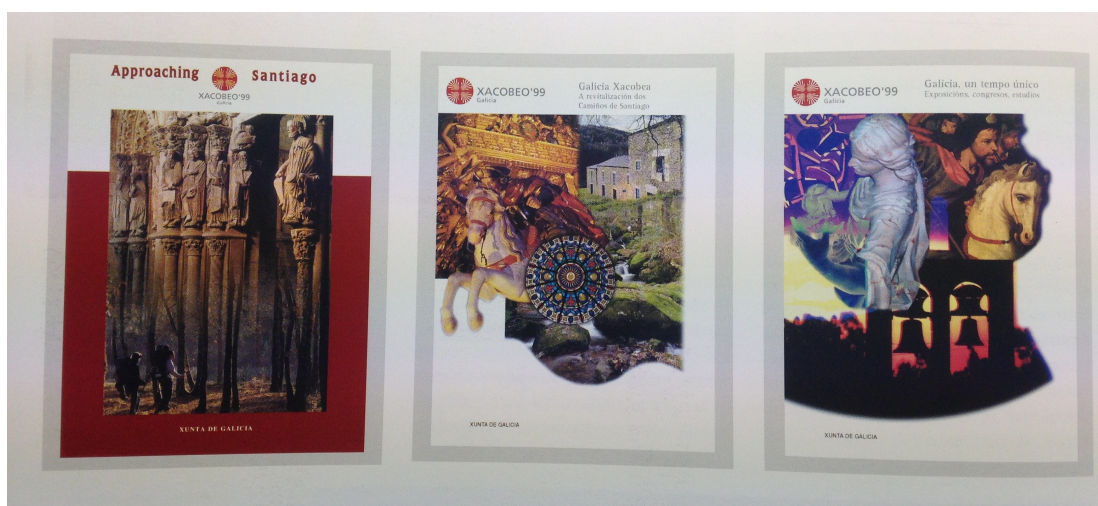
Imagen 3 Muestra de las guías y libros de apoyo del Camino de Santiago, (Xunta de Galicia 1999; 54)

Las acciones de promocionales en el extranjero consistieron en mostrar la figura del Apóstol Santiago, el origen histórico de la tradición Jacobea y la programación del Xacobeo 99. Esto se produjo en las principales convenciones turísticas del mundo. Es de destacar la representación en las principales ferias de turismo del mundo con la presencia de un stand dedicado al Camino de Santiago y al Xacobeo.