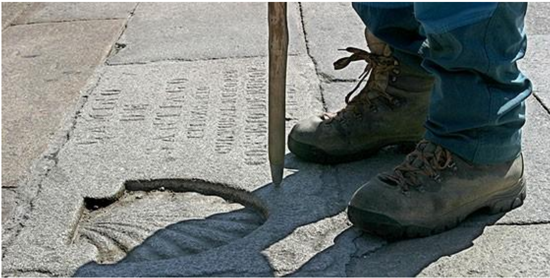
Imagen 7. Los pies de un peregrino en su llegada a Santiago de Compostela (