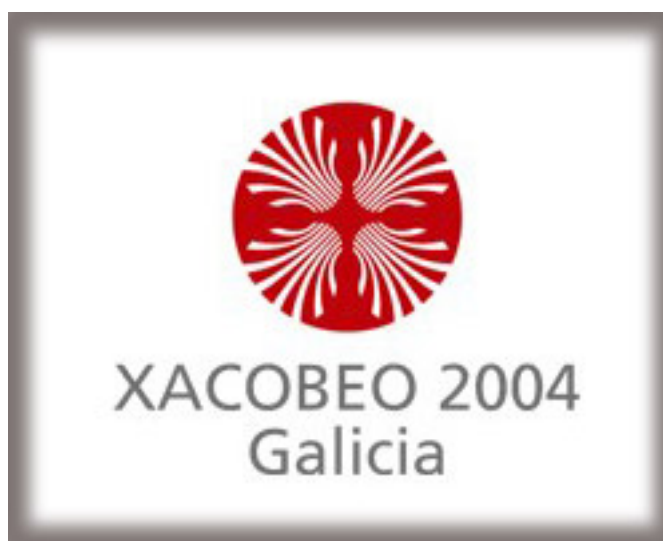
Imagen 4: Logotipo del Xacobeo 2004

La imagen del Xacobeo creada por el diseñador compostelano Alberte Permuy se basó en la sencillez y en que sería la representación del Camino de Santiago y de Galicia por todo el mundo. Cuatro conchas de vieira blancas enmarcadas por un círculo rojo conformaban el símbolo del Xacobeo 2004. Acompañado por la tradicional mascota, Pelegrín.