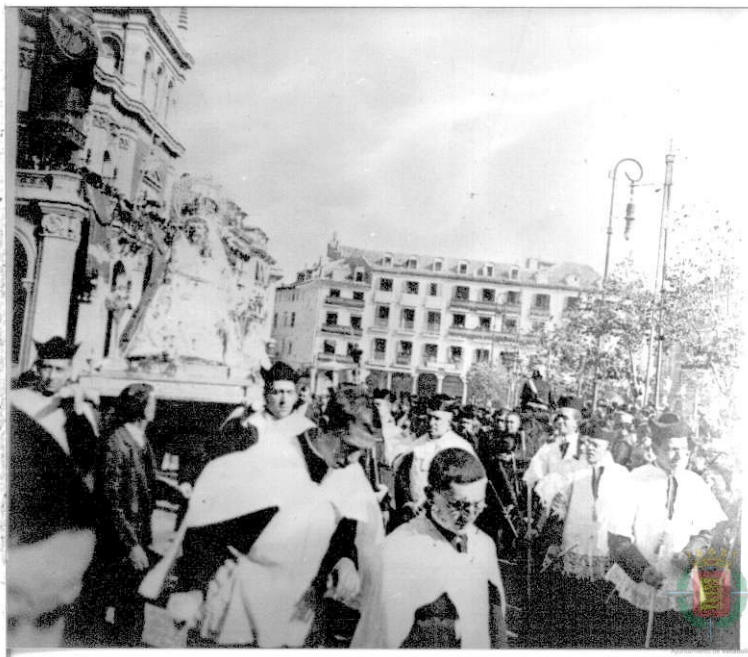
Fiestas patronales de Valladolid. 1917.