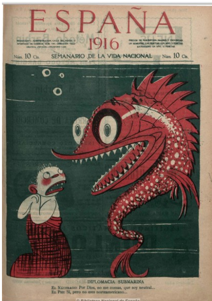
Aliadófilos y germanófilos dentro de la cultura española. Periódico con ilustración en la que se representa al Imperio alemán como un monstruo marino. Diario España , 17 de febrero de 1916.