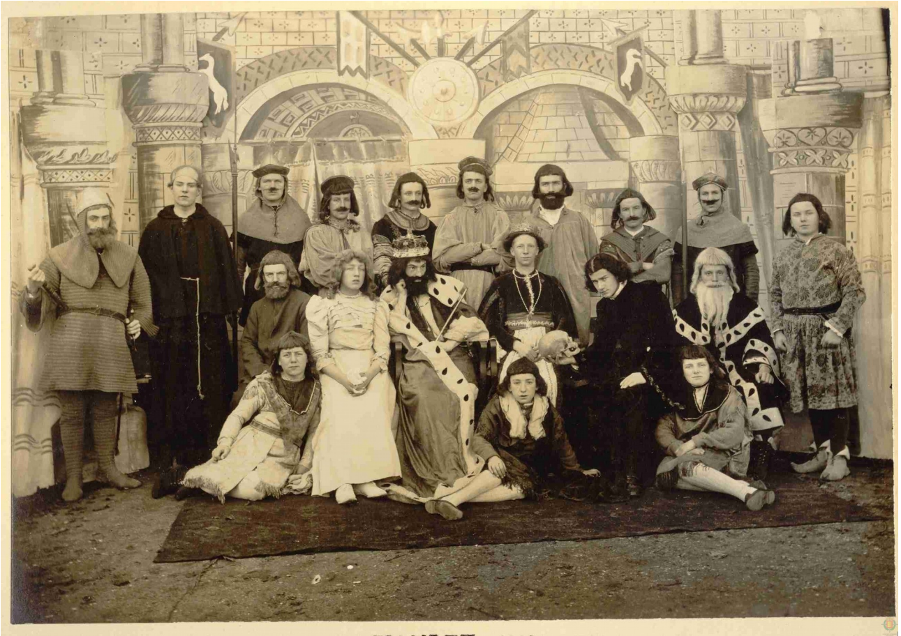
Representación teatral de Hamlet. Colegio de los ingleses. Archivo municipal de Valladolid, 1914.