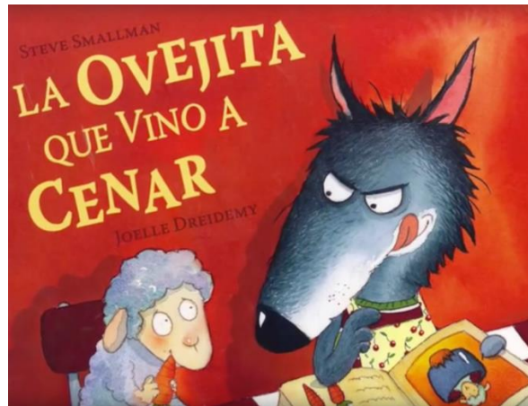
Imagen 1: Portada