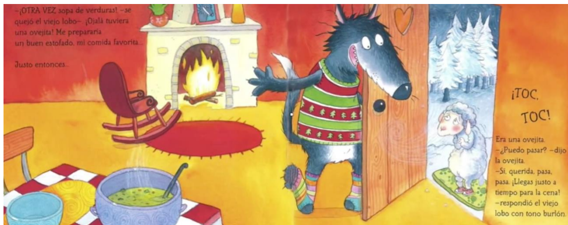
Imagen 2. Página primera del libro