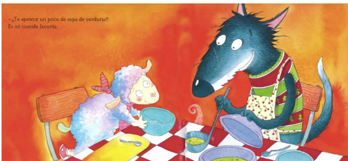
Imagen 6. Página final del libro.