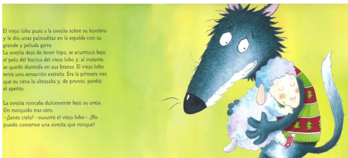
Imagen 3. Página 7 del libro.