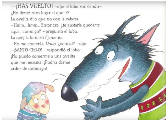
Imagen 5. Página 17 del libro.