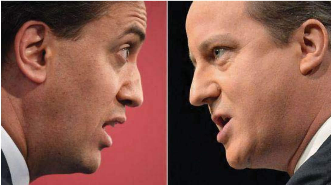
Ed Miliband (izquierda) y David Cameron.