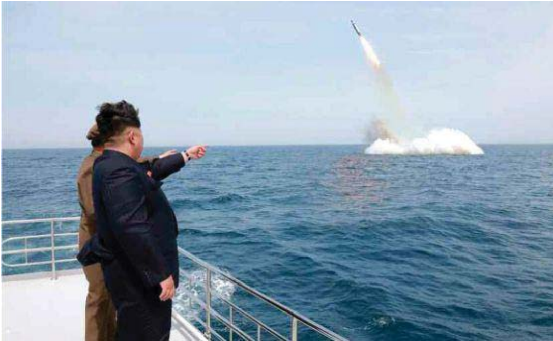
Kim Jong-un supervisa el lanzamiento del misil balístico.

Corea del Norte ha lanzado su primer misil balístico submarino bajo la supervisión del máximo líder del país, Kim Jong-un, según ha informado este sábado la agencia estatal de noticias KCNA. Ninguna fuente independiente ha confirmado la prueba, que supondría una violación de la prohibición de la ONU a Pyongyang de usar este tipo de armamento.