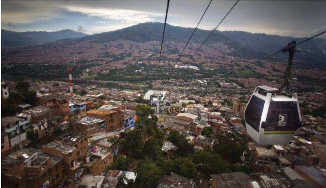
El metrocable de Medellín.