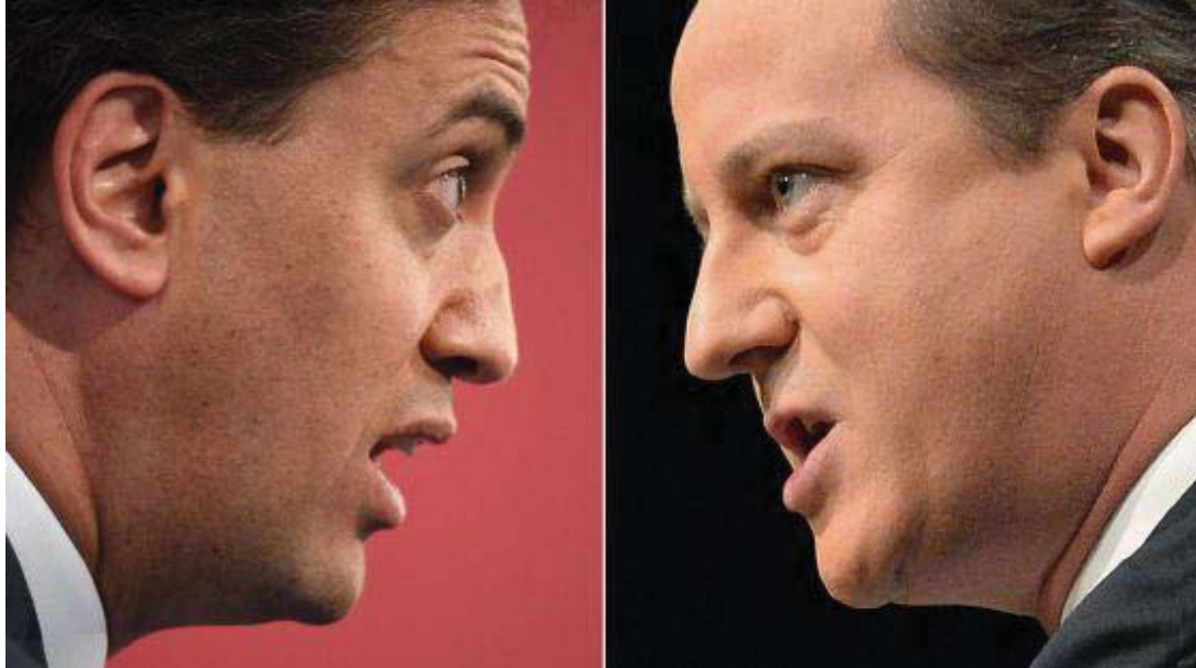
Ed Miliband (izquierda) y David Cameron.