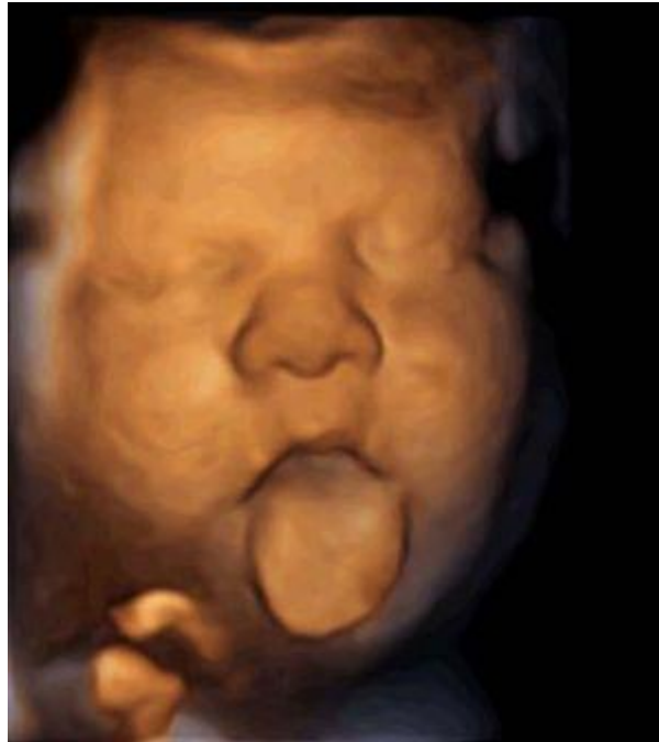
Figura nº2: Imagen ecográfica de un feto sacando la lengua durante la estimulación musical con Babypod. El País, 6 de Octubre de 2015.

Este último estudio ratifica la funcionalidad del oído desde la semana 16 y afirma que la música vía vaginal permite al feto oír como un neonato, sin distorsiones y con la misma intensidad. Este uso de la música a través de este dispositivo es alentador, ya que podría ser incluso un instrumento para descartar en fases tempranas la sordera fetal. (Mouzo J; 2015)