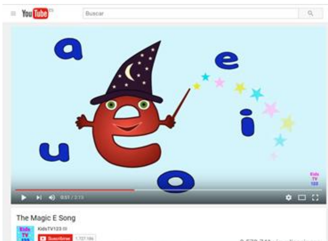
Figura1. The Magic E Song.( KidsTV123, 2011)