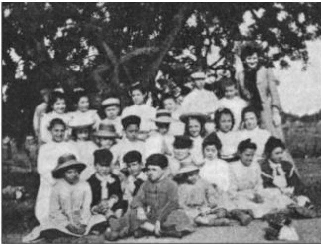
Alumnos de la escuela moderna, boletín de la Escuela Moderna, nº8, 1 de junio de 1902

En un país culturalmente atrasado culturalmente e intelectualmente, la coeducación fue un progreso grandísimo tanto para las niñas como para los niños. Aunque no era una excepción en los pueblos más rudimentarios, el cura o algún vecino se veía en la obligación de enseñarles tanto a niños como a niñas en una misma clase, era legal si no tenían los recursos suficiente los propios ayuntamientos como para pagar a un maestro y a una maestra. Sin embargo, en ciudades y villas era completamente inusual poder ver escuelas mixtas, Ferrer tuvo la ocasión de poder verlo en un pequeño pueblecito. Él estaba bastante atento y preguntaba a cualquier persona si tenía niñas en su familia, aunque el trabajo se hacía cansado, al final daba sus frutos.