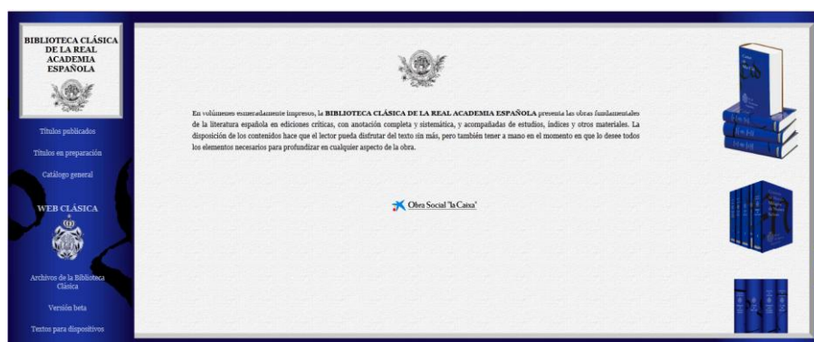
Página web de la BCRAE

Además de esta serie Básica comentada, la RAE prevé a largo plazo otras dos modalidades de publicación y divulgación: la Biblioteca Clásica del Estudiante y la Biblioteca Clásica de Bolsillo , cuyos volúmenes se irán escalando en función de los títulos disponibles en la serie Básica . En las páginas web de la RAE ( http://www.rae.es y http://www.bcræ.es ) se ofrecerán materiales de apoyo a la colección (facsimiles de manuscritos y ediciones antiguas, reproducción de obras que no se reimprimirán, textos breves para dispositivos o chats con académicos, escritores y filólogos tras la aparición de cada volumen). Asimismo, en la web académica de la RAE se irán haciendo accesibles de forma gratuita las ediciones de las obras en formato pdf y para los principales tipos de e-book.