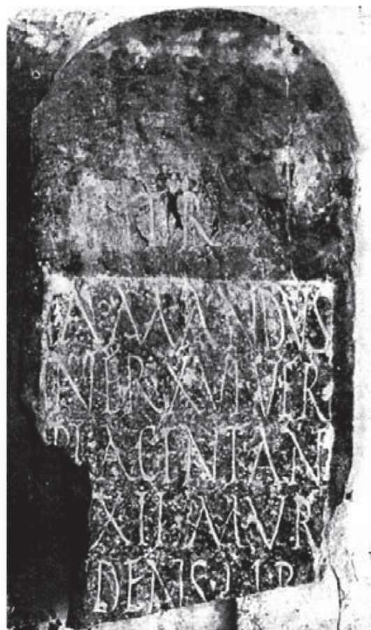
Fig. 6.- Epitadio de Amandus (CENTRO CIL)