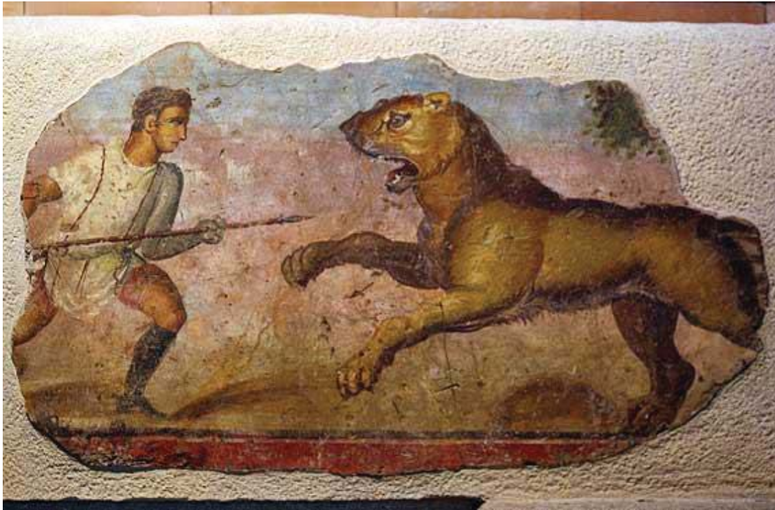
Fig. 3.- Representación de un mural de lucha con animales (Museo Nacional de Mérida)

El coste de una venation era muy superior al de los munera llegando a costar un león en Roma en el siglo III d.C. la friolera cantidad de 150.000 HS, un leopardo 100.000 HS y un oso 60.000 HS. En los municipios el coste era mucho menor pero aun así era superior al de los munera . Al precio de los animales había que sumarle la gran decoración que se realizaba en los anfiteatros, adornándose numerosas veces con plantas, rocas, estanques e incluso riachuelos para simular bosques y selvas y de este modo dar el mayor realismo posible a la cacería.