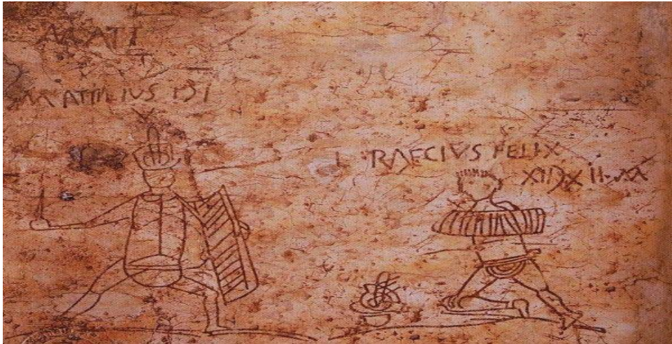
Fig. 4.- Mosaico del Museo Nacional de Mérida. Representación de varios gladiadores

De la misma manera existieron emperadores que por su gran afición a las luchas de gladiadores bajaron a la arena a combatir. Los casos más destacables son el de Calígula y Nerón aunque solamente combatían en arenas privadas, al igual que Tito, Adriano, Didio Juliano, Caracala, Macrino y Cómodo.