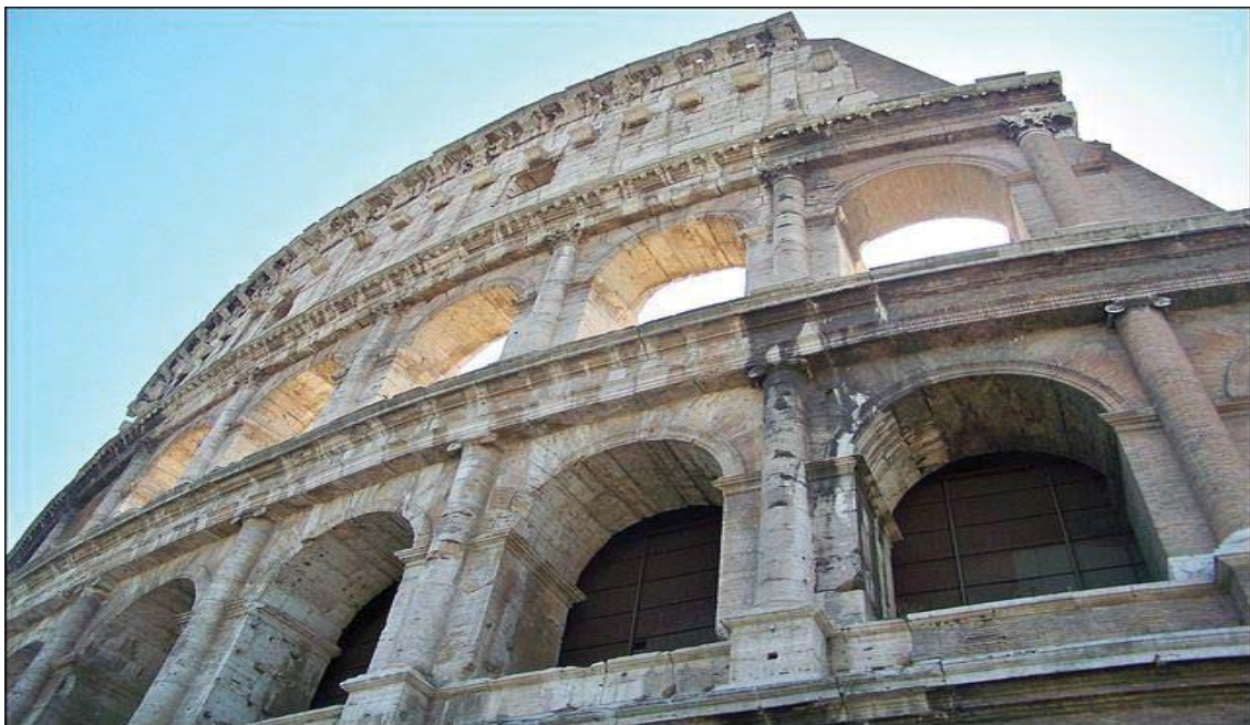
Fig. 1.- El coliseum de Roma

Cuando el munus comienza a orientarse hacia la propaganda de los políticos su realización cambiará de lugar, se empiezan a producir en lugares públicos donde una gran aglomeración de gente fuera posible, de modo que el lugar más idóneo para hacerlos eran los foros, siendo el Forum Boarium 12 el primer lugar donde se realizaron. Para que el espectáculo pudiera ser visto de una manera más cómoda y evitar peligros como que algún gladiador pudiera llegar a herir a un espectador, se comenzaron a construir gradas portátiles las cuales después del espectáculo se desmontaban. Todos los gastos de esto corrían a cargo de quienes los organizaban.