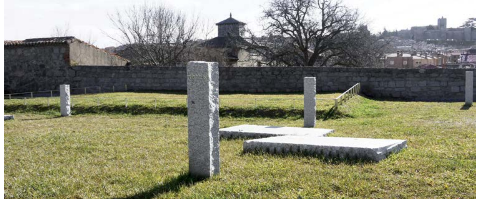
Fig. 19 (página opuesta) Jardín de Sefarad. Vista de detalle con la ciudad de Ávila al fondo.

VIRILIO, Paul (1988), Estética de la desaparición . Barcelona: Anagrama.