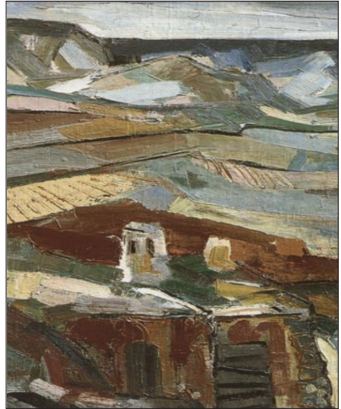
FIGURA 15. Fragmento de Paisaje , 1964.