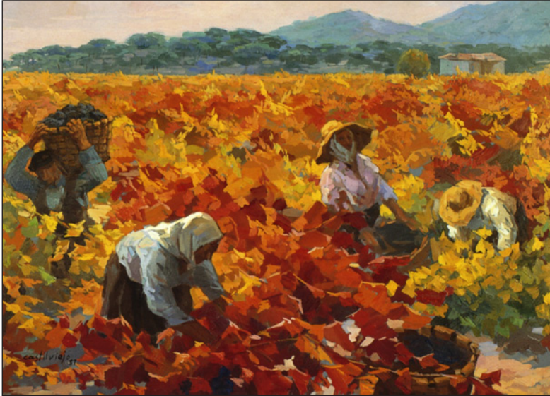
FIGURA 7: Fragmento de Vendimia en Vega Sicilia , 1987.