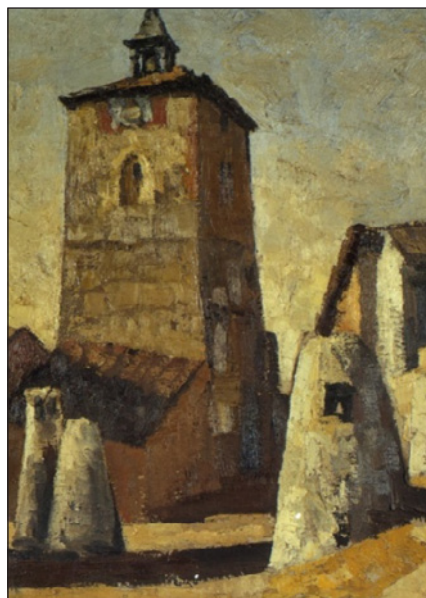
FIGURA 13. Fragmento de Torre del reloj , 1969.