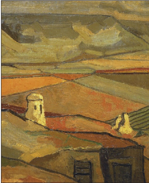
FIGURA 14. Fragmento de Zarceras de las bodegas de Valoria , 1964.

Fuente: Consejería de Educación y Cultura de la Junta de Castilla y León (2003).