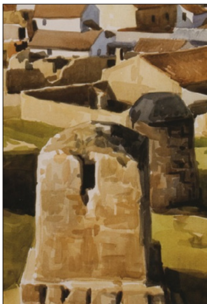
FIGURA 12. Fragmento de Pueblo año (¿?) .

La combinación de bodegas, terrazgo y formas de relieve dan lugar a una representación muy completa de este tipo de paisaje agrario como muestran las obras de Cuadrado Lomas con Zarceras de las bodegas de Valoria (Figura 14) y Gabino Gaona con Paisaje (Figura 15). Ambos representaron en 1964 una panorámica muy similar de las mismas bodegas, las de Valoria la Buena, reflejando su arquitectura y el entorno donde se enmarcan pero cada uno mostrando su propio estilo.