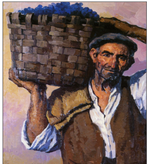
Figura 10. Fragmento de Sacatertero , 2001.