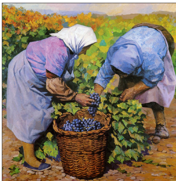
FIGURA 8. Fragmento de Las vendimiadoras , 2001.

Frente a esta figura aparece en la vendimia otra que posee gran importancia, los sacaterreros, hombres que se encargan de recoger los canastos llenos de uva y trasladarlos hasta el carro. En las figuras 9 y 10 se pueden ver dos representaciones de estos personajes. Cuentan con una serie de atributos comunes como son los rasgos de la cara, ambos con la mirada perdida, aparentemente cansada, con barba de varios días sin afeitarse y con arrugas en su rostro que vuelven a remarcar la crudeza del campo, ya que estas personas no solo se dedican a la recogida de la uva en épocas con un tiempo