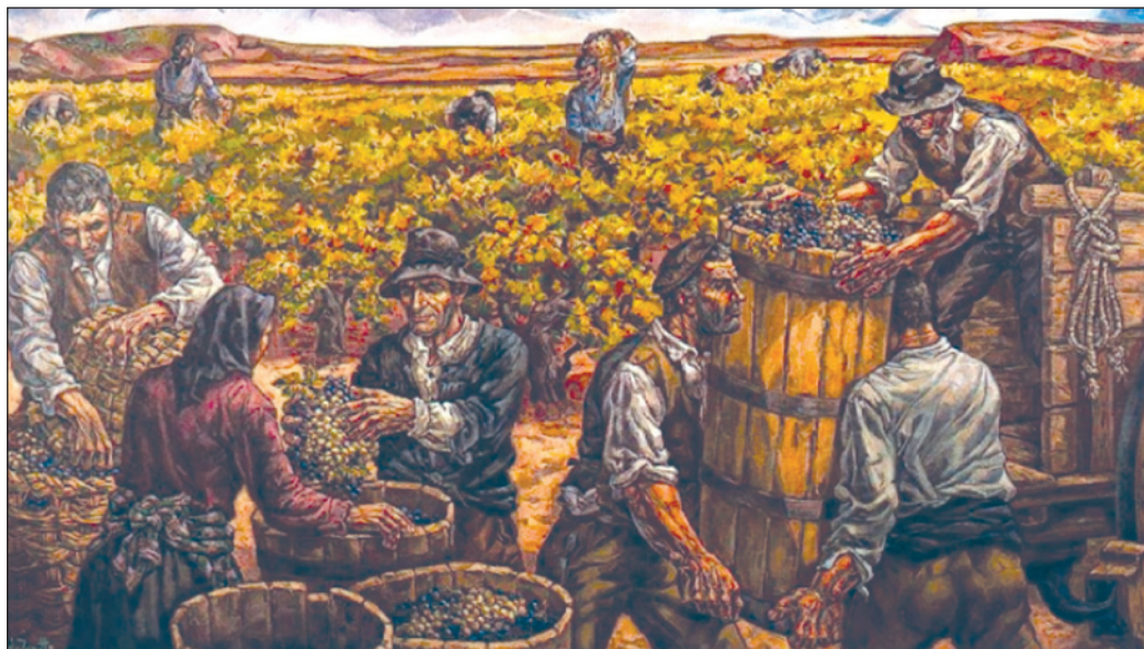
FIGURA 6: Fragmento de Vendimia en la Ribera del Duero , 1979.