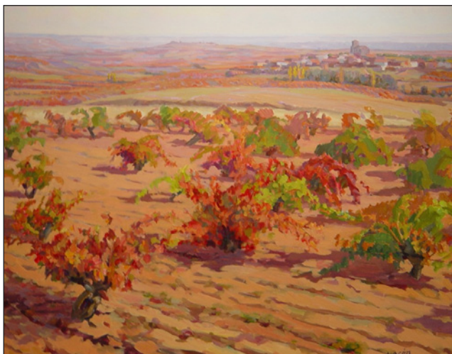
FIGURA 5. Paisaje de viñedos con pueblo al fondo, 2007. Fuente: Mariano Macón.

Como se ha podido ver, las obras de Cuadrado Lomas y Mariano Macón representan el mismo paisaje, el del viñedo, pero de formas muy diversas. Lomas se encarga de reflejar a la cepa desnuda, en su fase más triste y dando la sensación de soledad y frialdad a través del uso de colores grises, granates y ocre, algunos de ellos en gamas fuertes, así como por la presencia de figuras geométricas que crean un espacio más cerrado, con límites, un paisaje más artificial. Por otro lado Macón busca todo lo contrario, pretende despertar en la persona que contempla la obra la calidez de un paisaje que posee fuertes lazos de unión con las personas, y para ello lo hace con la cepa llena de hojas y de racimos de uva y empleando una paleta de colores más variada y más suave, plasmando un paisaje más vistoso y atractivo para la ojos humanos.