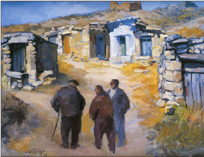
FIGURA 11. Fragmento de Bodegas , 2001.

dos elementos como son el grupo de hombres que se encuentran conversando entre ellos, se intuye que todos poseen una edad avanzada, probablemente antiguos viticultores que añoran los tiempos en los que se encargaban ellos mismos de elaborar el vino, mientras que en el fondo se puede ver el paisaje propio derivado de estas construcciones como son los cotarros con la presencia de un palomar en ruinas. El resto de la composición se completa con una serie de pinceladas sueltas que van dando forma a la obra como son los caminos y las malas hierbas existentes en los bordes de las bodegas.