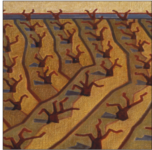
FIGURA 3. Fragmento de Viñas podadas , 2001 y FIGURA 4. Fragmento de Viñas podadas , 2001.

de los pueblos de Castilla que se vuelven a quedar sin gentes hasta la llegada del buen tiempo. El caminar ahora, por sus calles vacías y oscuras, refleja el abandono y el retiro de estos espacios que esperan con ansia la llegada del buen tiempo y de sus moradores que un día decidieron abandonarlo.