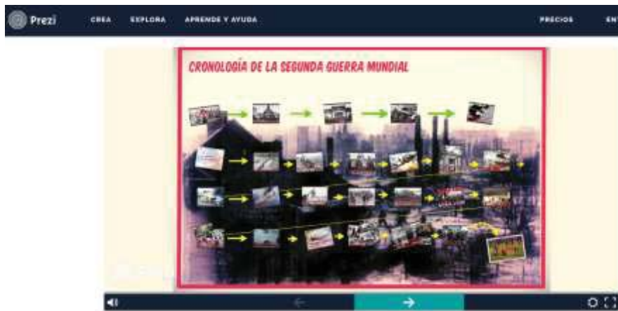
Fig. 3. Trabajo en presentación Prezi