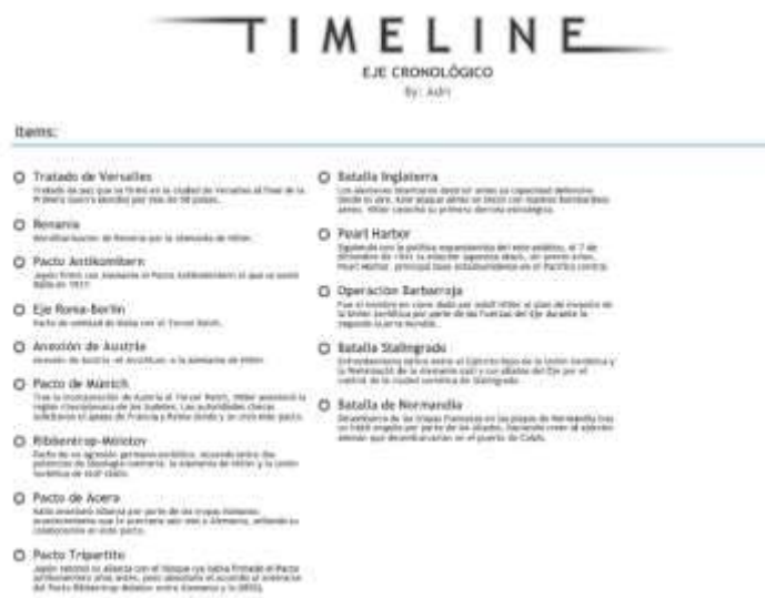
Fig. 2. Trabajo en formato Time Line II