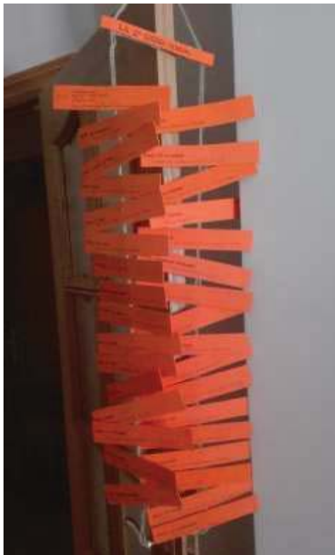
Fig. 4. Trabajo de manualidades