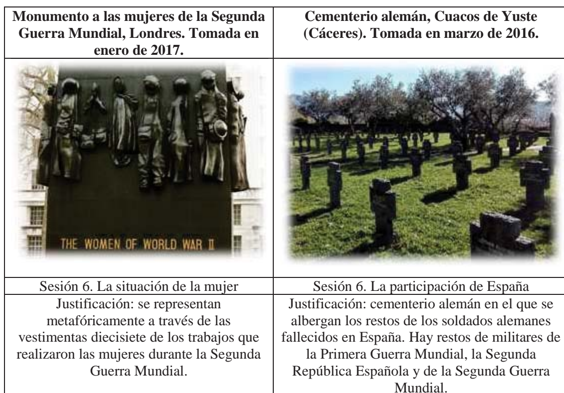
Tabla 38. Fotografías personales

Además, cabe señalar que, respecto a la apuesta por llevar al aula fotografías personales, en este caso se presentan las siguientes: