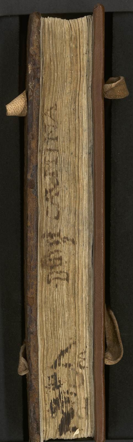
UVA. BHSC. IyR_251