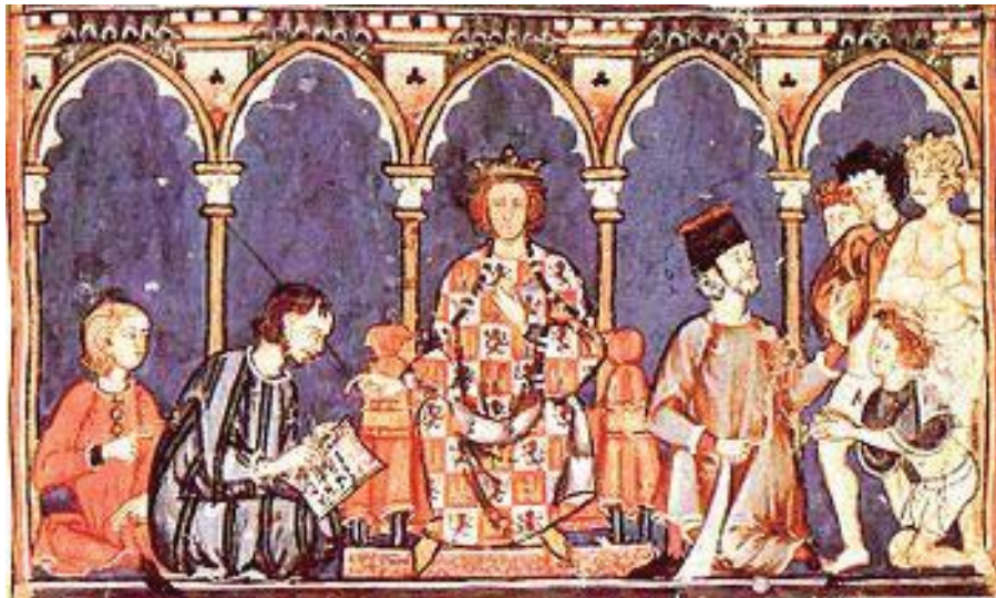
Anexo IX: Miniatura de Alfonso X el Sabio con sus colaboradores. 68