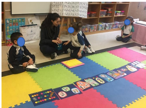
Actividad del cuento. Repartiendo los bombones.

Los demás elfos no tardaron en imitar a Pin y a Flop, y pronto cada niño tuvo en su interior un elfo de la felicidad. El mismo que aún hoy nos habla todos los días para decirnos que para ser verdaderamente felices hay que olvidarse un poco de las propias diversiones y hacer algo más por los demás.