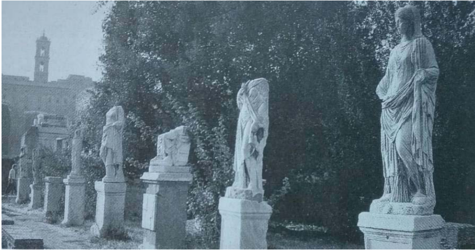
FIG. 5. Pórtico del atrio central de la Casa de las Vestales en Roma en el cual se conservan algunas estatuas y basas de diversas Vestales Máximas. (Foro de Roma, imagen tomada de SCHEID, J. (1991): “Extranjeras indispensables. Las funciones religiosas de las mujeres en Roma”. En Duby, G. y Perrot, M. (eds.): Historia de las mujeres en Occidente. (Madrid, 1991). Taurus, pp.421-504.