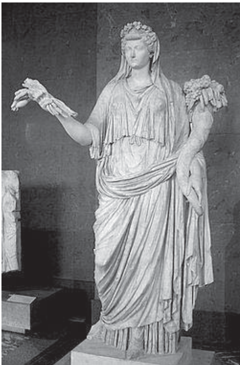
FIG. 6. Estatua de Livia ataviada como Ceres (Museo del Louvre, Paris).