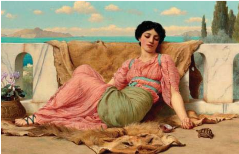
FIG. 3. La ociosa pose de una joven matrona romana, retratada por John William Godward (1906), uno de los artistas más significativos del movimiento prerrafaelista, es un distorsionado del ideal neoclásico, poco acorde a la realidad de la mujer retratada, Terencia, la esposa de Cicerón. Imagen tomada de: FERRER ALCANTUD, C. (2014): “La mujer romana y el ejercicio del poder a través del control de las finanzas: El caso de Terencia, esposa de Cicerón”, Potestas , 7, pp. 5-25.