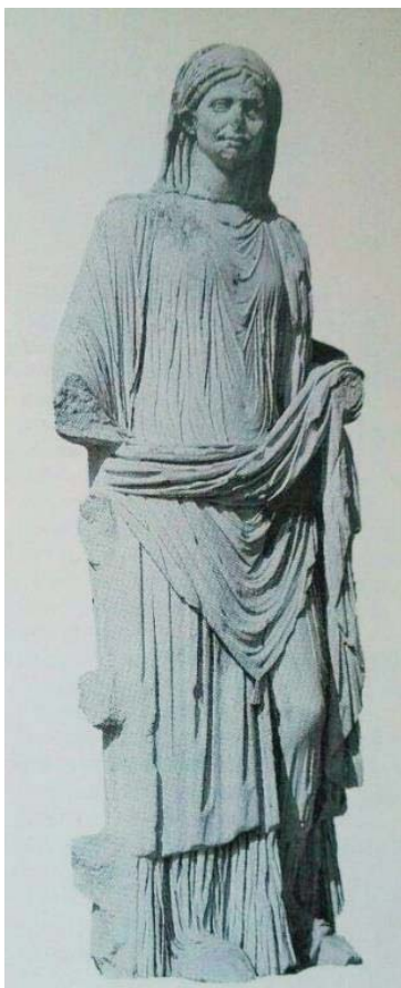
FIG. 4. Estatua de una Vestal Máxima en el atrio de la Casa de las Vestales en Roma. Siglo II d. C. Roma Foro Romano.