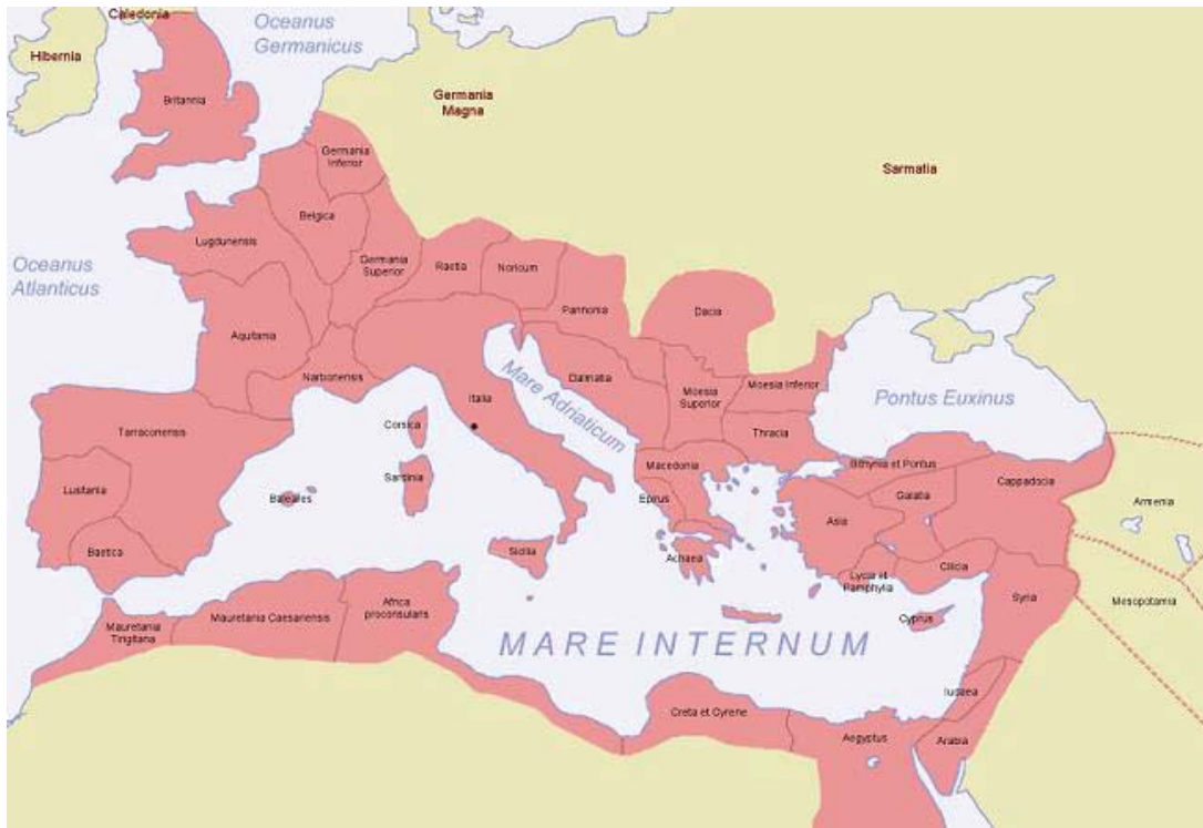
FIG. 1. El Imperio Romano durante el reinado de Marco Ulpio Trajano (98- 117 d. C).