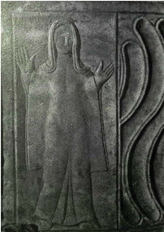
FIG. 10 Figura femenina de un sarcófago paleocristiano que representa una mujer difunta, con una actitud noble. Lleva una túnica con mangas anchas y un velo que cubre su cabeza (símbolo de dignidad y de decencia). Imagen tomada de MONIQUE A. (1991): “Imágenes de mujeres en los inicios de la cristiandad” En Duby, G. y Perrot, M. (eds.): Historia de las mujeres en Occidente . (Madrid, 1991). Taurus, pp. 463- 511.