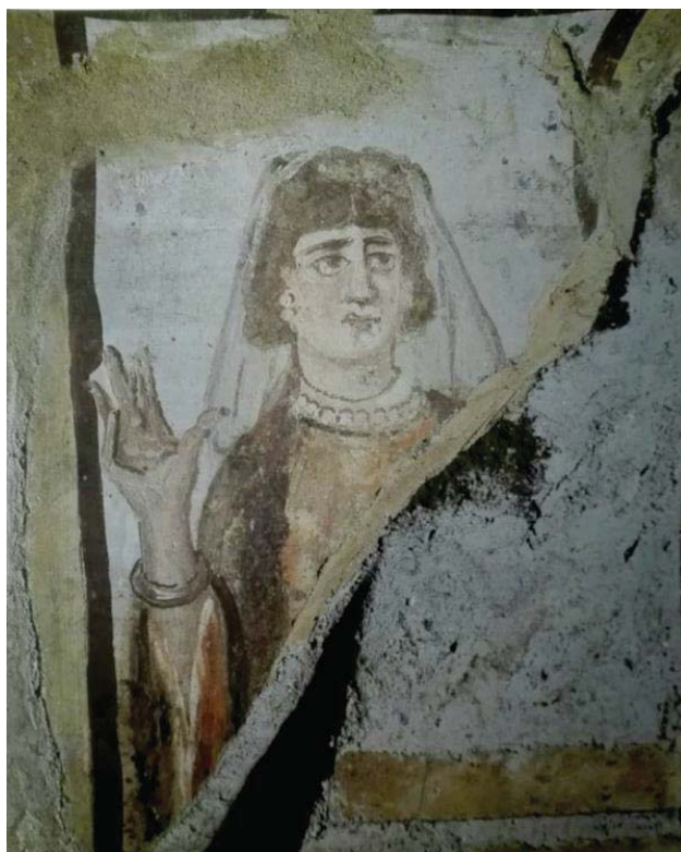
FIG. 8 Pintura paleocristiana de las catacumbas de la Villa Massimo. Retrato sepulcral de una difunta descoocida con gesto de orante. Lleva un velo transparente sobre la cabeza y un manto. Siglo IV. Imagen tomada de MONIQUE A. (1991): "Imágenes de mujeres en los inicios de la cristiandad" En Duby, G. y Perrot, M. (eds.): Historia de las mujeres en Occidente . (Madrid, 1991). Taurus, pp. 463- 511.