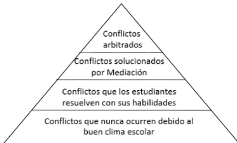
Figura 3: Pirámide Cohen y la gestión de conflictos. Gráfico obtenido de documento: “Gestión positiva de conflictos y mediación en contextos educativos” (2013).

Si estos conflictos son tratados en el Centro Educativo mediante una resolución positiva de los mismos, el clima escolar será de calidad y de esta manera, muchos de los conflictos tan siquiera aparecerán debido a que los mismos alumnos lo solucionarían por sí mismos antes de que el conflicto surja como podemos ver en la base de la pirámide (figura 3).