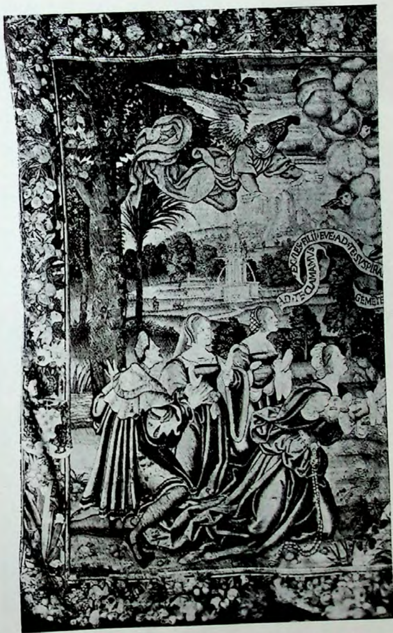
Lámina VI.—Segundo tapiz (Pormenor).—Grupo de orantes.