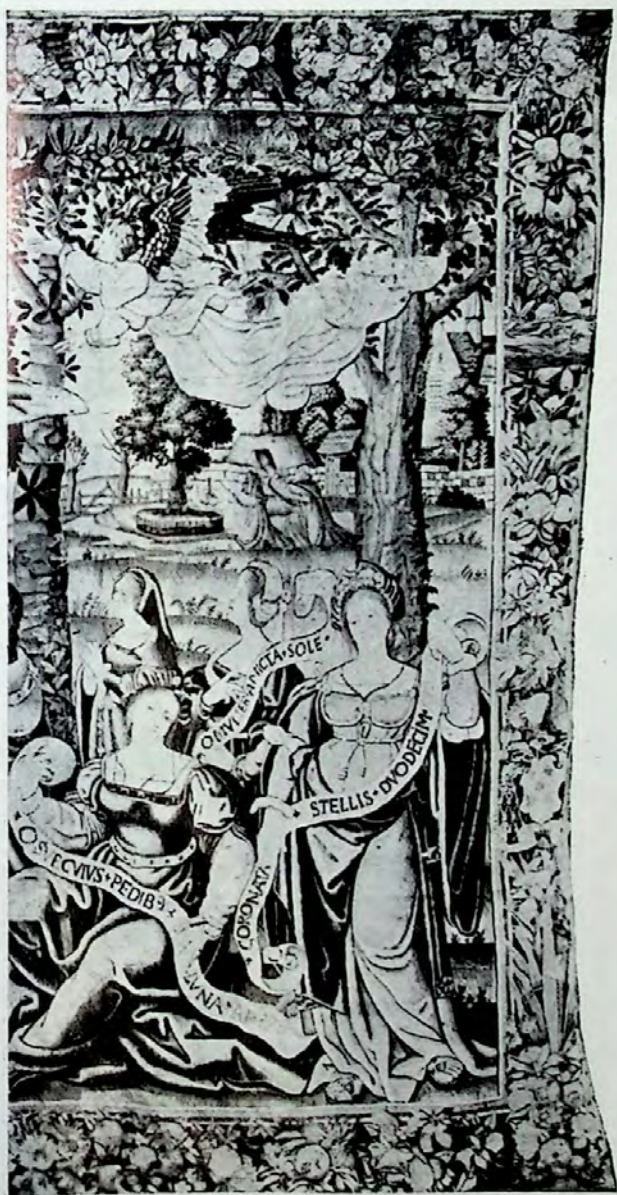
Lámina IV.—Primer tapiz (Pormenor).—Grupo de matronas portadoras de filacterias.