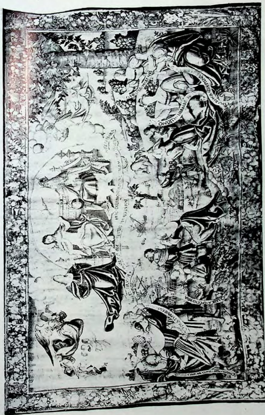
Lámina XII.—Cuarto tapiz.—Et Ihesvm benedictum fructum ventris tui nobis post hoc exilium ostende, o clemens, o pia, o dulcis Virgo Maria.