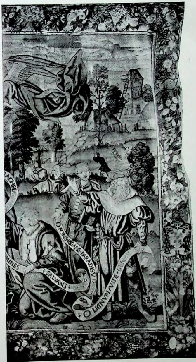
Lámina VIII.—Segundo tapiz (Pormenor).—Grupo de Profetas con filacterias.