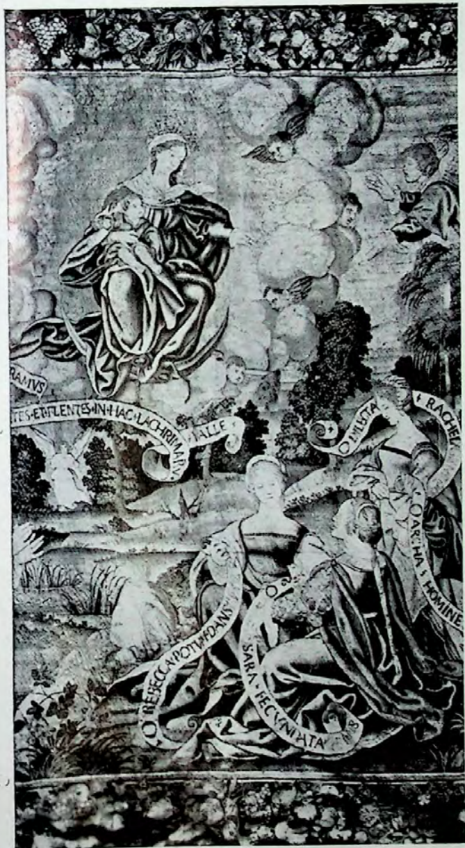
Lámina VII.—Segundo tapiz (Pormenor).—La Virgen y el Niño. Grupo de matronas portadoras de filacterias.