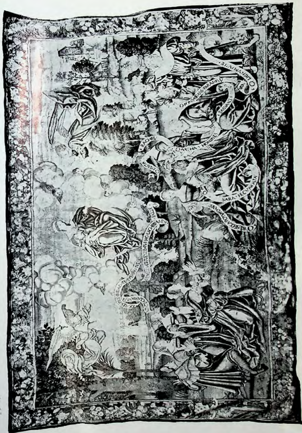
Lámina V.—Segundo tapiz.—Ad Te clamamus exules filii Eve ad Te suspiramus gementes et flentes in hac lacrimarum valle.