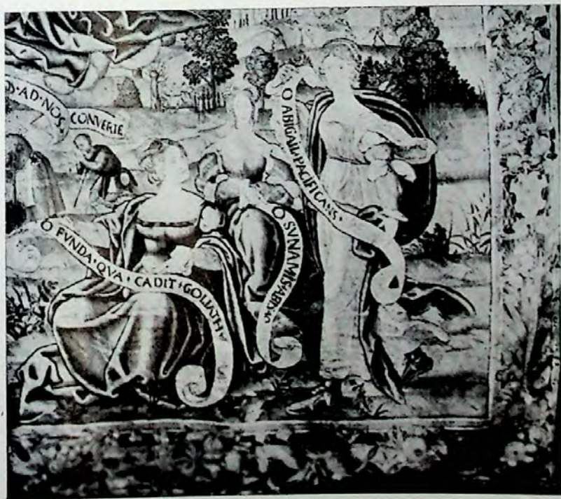
Lámina XI.—Tercer tapiz (Pormenor).—a) Grupo de suplicantes y Profetas portadores de filacterias.—b) Grupo de matronas con filacterias.