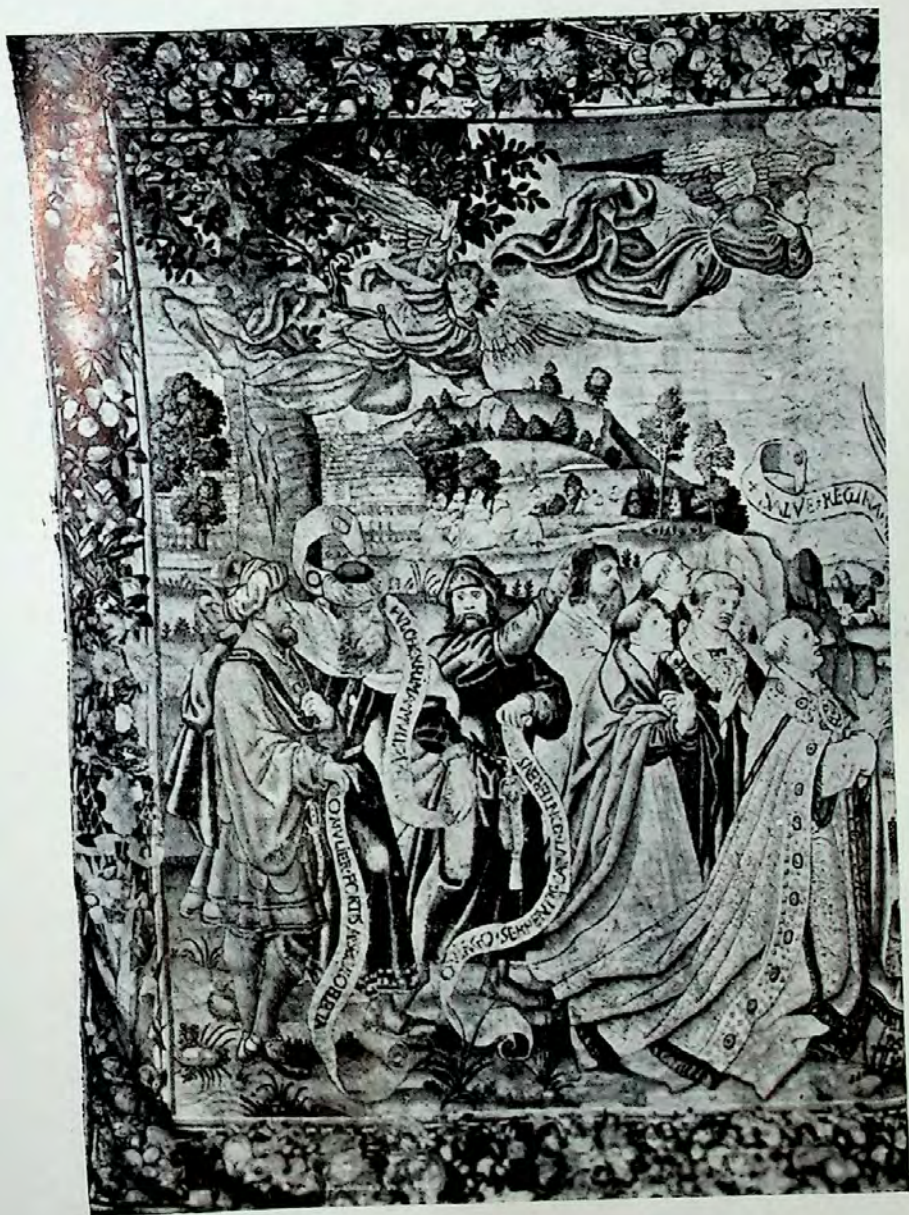
Lámina II.—Primer tapiz (Pormenor).—Grupo de Profetas portadores de filacterias. La Iglesia rinde culto a la Santísima Virgen.