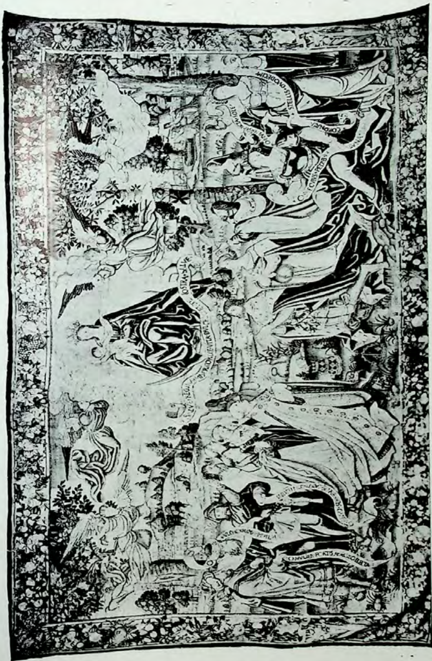
Lámina I.—Primer topiz.—Salve Regina (Mater) Misericordie vita divedo et spes nostra salve.

(En los pies de las láminas se respeta la grafía de las filacterias).