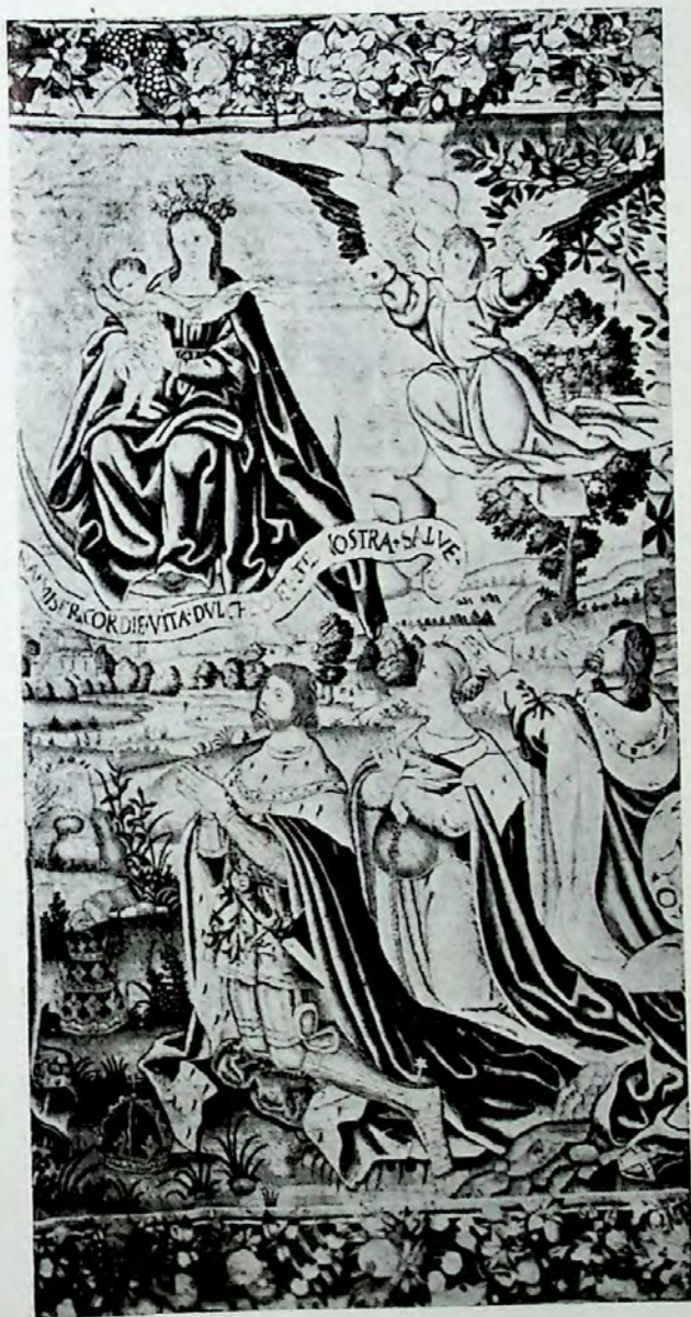
Lámina III.—Primer tapiz (Pormenor).—Los poderosos de la tierra rinden culto a la Reina del Cielo.