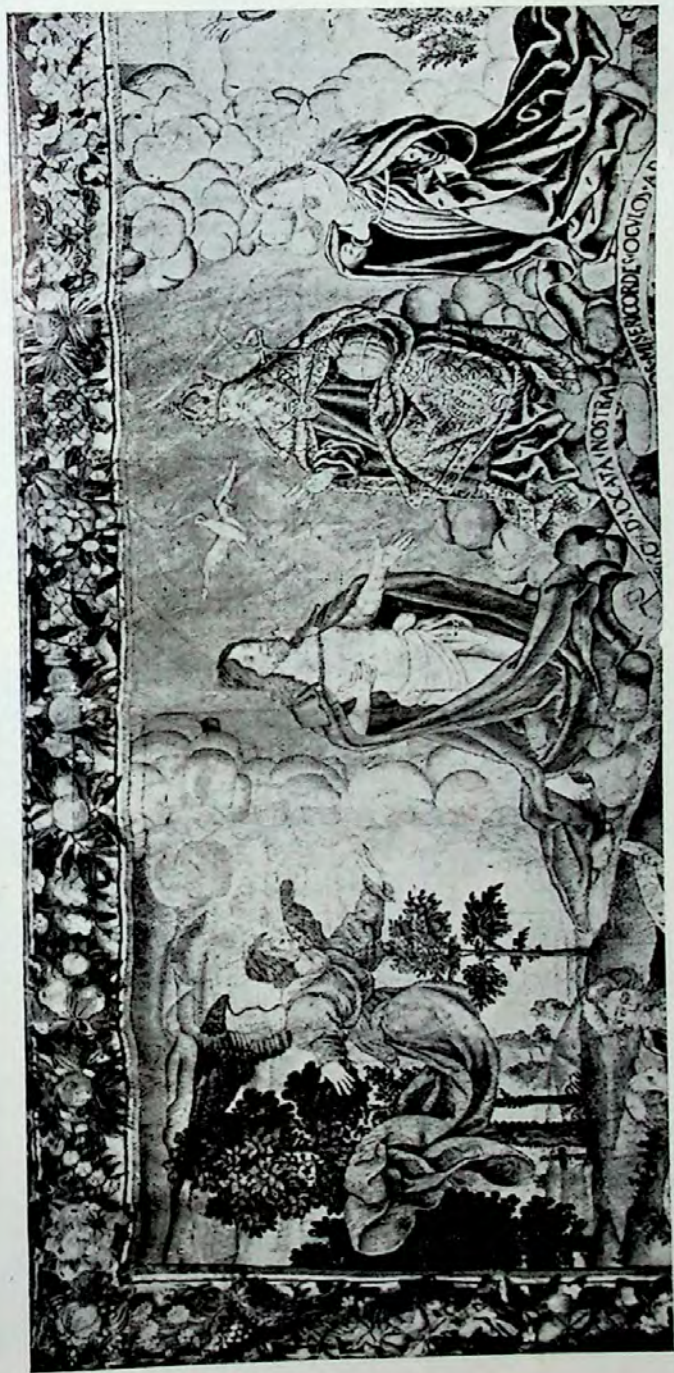
Lámina X.—Tercer tapiz (Pormenor).—La Santísima Trinidad y la Virgen mediatadora.