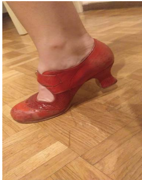
Tacón para representar el taconeo