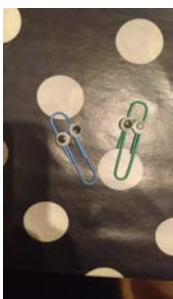
Los clips serán los mosquitos del poema.