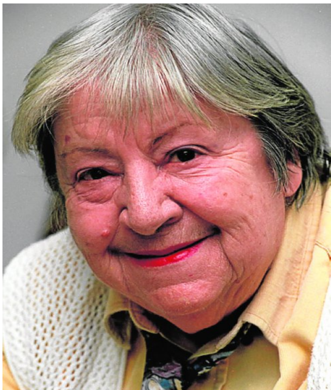
*Imagen 1: Cara de Gloria Fuertes, la cual tendremos en el aula, a lo largo del proyecto