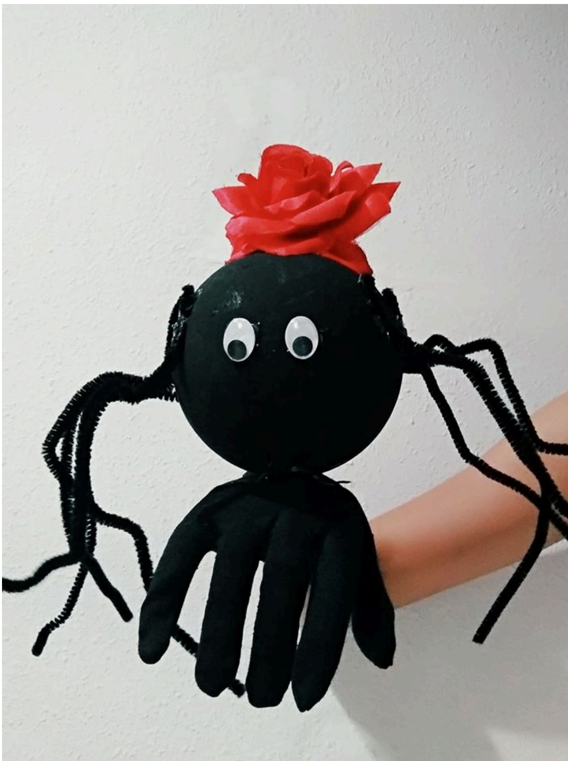
La araña de España

ANEXO 5. Foto de la mascota, Actividad 1 de la segunda sesión