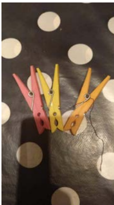
Pinzas que representan a los pajaritos