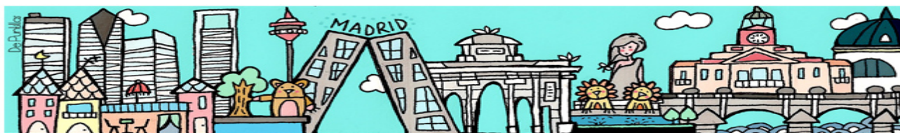
*Imagen 2: Madrid, fue dónde nació y creció, hablando con los niños sobre la ciudad.