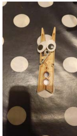
Lechuza del poema