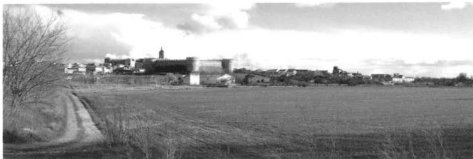
Fig. 2 - Vista de la silueta paisajística de Grajal desde la ribera del río Valderaduey, al noroeste del núcleo.

manifestación marginal de un pasado bien comprendido. El pequeño monte de encinas y robles fue arrasado y convertido en tierras de cereal. El río Valderaduey fue encauzado para minimizar el riesgo de avenidas. Las estructuras agrarias fueron replanteadas mediante un proyecto de concentración parcelaria, que modificó la caminería tradicional, y, en definitiva, ha resultado un paisaje más uniforme y ecológicamente menos complejo, aunque reconocible.