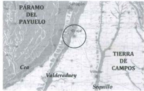
Fig. 1 - Detalle manipulado del Mapa Geológico de Síntesis de España a escala 1:50.000, serie Magna, hojas 196 y 234. Los tonos claros de los limos carbonatados del Mioceno se corresponden con la Tierra de Campos (marcados por los limos y arenas de las llanuras de inundación de los ríos Valderaduey y Sequillo). Al Oeste del río Cea, los tonos oscuros se corresponden las amplísimas terrazas fluviales que caracterizan al Páramo del Payuelo.

herbáceas), y por el Este a las llanuras onduladas de la Tierra de Campos (tradicionalmente dedicadas a las herbáceas de secano, de trigo en el pasado: tierras “de pan llevar”).