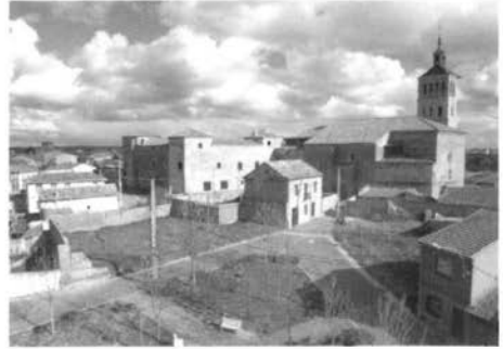
Fig. 3 - El palacio y la iglesia parroquial de Grajal vistos desde el castillo.

de centralidad de la localidad. El hecho de que la iglesia fuese realizada en conexión con el palacio facultó una excepción entre los pueblos de entonces. Mientras que en la mayoría de los núcleos de conformación medieval la iglesia y el ayuntamiento tenían cada uno su propia plaza o espacio abierto vinculado, en Grajal fue pensada la plaza como centro del espacio público, con el empaque de una galería palacial presidiéndola. La plaza de la villa dispuso de un nuevo valor en tanto en cuanto la galería palacial del mediodía se dispuso logrando una emblemática presencia al costado del Ayuntamiento.