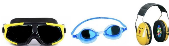
Figura 1. Gafas de simulación de reducción de visión y cascos.

A medida que vaya transcurriendo los diferentes retos cooperativos, se introducirán variantes como tapar los ojos, privarles de alguna extremidad, taparles la boca, etc., para concienciar así al alumnado de que todos podemos realizar actividad física y, que para superar los retos propuestos, debemos ayudarnos unos a otros como un gran equipo. Para hacer a un alumno cojo, manco y mudo se utilizará el material disponible del colegio, en cambio, para realizar la ceguera se les proporcionará unas gafas de simulación de reducción de visión y, para la sordera unos cascos con algodón. A continuación se pueden ver imágenes (ver Figura 1) del material mencionado.