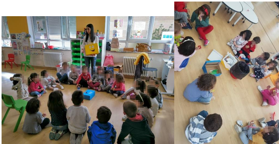
Ilustración 11: Nos implicamos en el reciclaje.