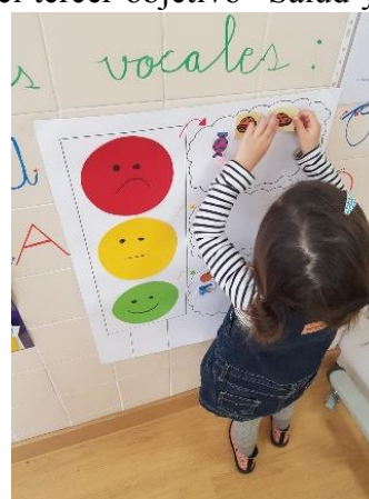
Ilustración 5: Semáforo de los alimentos.

Con esta actividad pretendemos concienciar a los niños y niñas de la importancia de la buena alimentación, así como reconocer aquellos alimentos saludables. Para ello, nos apoyaremos en un vídeo de Groovy el Marciano 1 desde el segundo 0:00 hasta 6:14 minutos. Además, con esta actividad se pretende que muchos de los niños y niñas cambien hábitos de alimentación ya que al almuerzo muchos de ellos no lo llevan saludable.