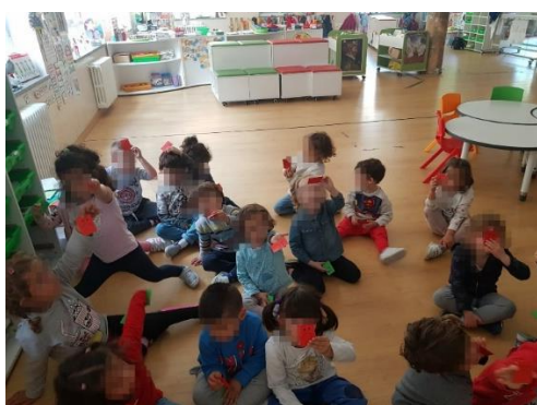
Ilustración 15: ¿Hay diferencias entre nosotros?