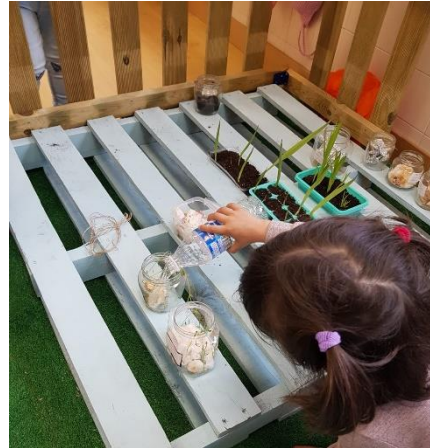
Ilustración 3: Niña regando las flores.

Comenzaremos recordando la imagen con la que se presentó la propuesta didáctica, la Tierra triste. A partir de ella comenzaremos a explicar uno de los ODS, el objetivo decimotercero “Acción por el clima”. Visto que en la imagen aparecían los árboles cortados, les haremos reflexionar a los alumnos y alumnas la importancia de cuidar nuestro medio ambiente, ya no solo no cortando los árboles, sino también cuidándole en la manera de no arrojar aquello que no queramos en el suelo de nuestro entorno ya que nos contamina.