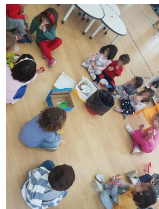
Ilustración 4: Reciclaje en la merienda.

Con esta actividad lo que se pretende es que los niños sean conscientes de la importancia del reciclaje y las consecuencias que tiene realizar esta acción. Comenzaremos a reciclar utilizando unas cajas de colores, los correspondientes a los contenedores de reciclaje. Además, les explicaremos el proceso de reciclaje para concienciarles de su importancia y no realizar un gasto excesivo de la producción.