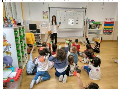
Ilustración 6: Actividad “Cuidamos el agua”

Esta actividad consiste en ir sacando diferentes imágenes de los usos del agua, tanto usos que son responsables con el agua como usos que no lo son. Los niños deben diferenciar aquellos usos que sean responsables y pegarlos en la pizarra en la parte de cara sonriente y los que no son responsables en la cara triste. Las imágenes empleadas para el desarrollo de la actividad se han obtenido mediante fuentes digitales.