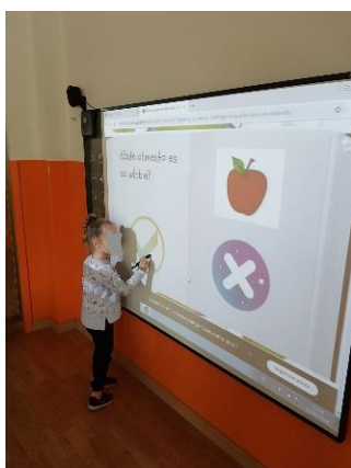
Ilustración 16: Juego final de repaso.