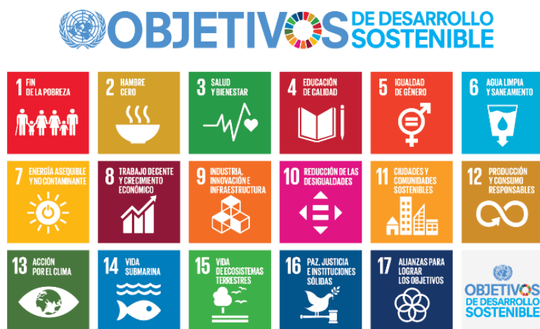
Ilustración 1: Objetivos del Desarrollo Sostenible.

Concretamente, los ODS establecidos por la ONU en 2015 fueron 17. Según afirma Sanahuja (2014): “los ODS deben tener carácter global y ser universalmente aplicables, aunque se han de adaptar a las realidades y políticas nacionales” (p.64). Los ODS tienen diferentes metas que se pretende conseguir para 2030. Estos 17 ODS los detallamos en la Tabla 7, situado en el Anexo I, aunque la Ilustración 1 muestra la imagen icónica de los 17 ODS que promueve la ONU.