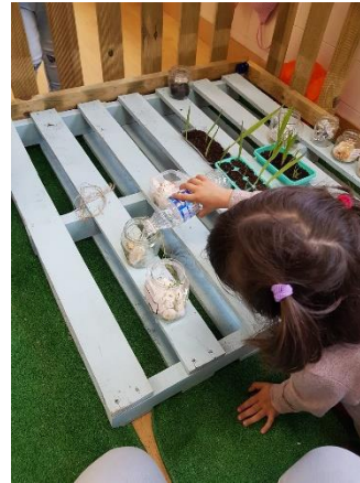
Ilustración 10: Regamos la planta.