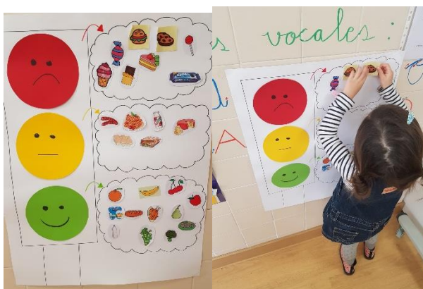
Ilustración 12: semáforo de los alimentos.