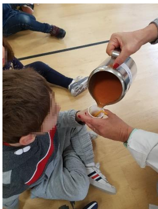
Ilustración 13: Merienda saludable.