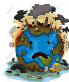
Ilustración 8: Tierra triste.