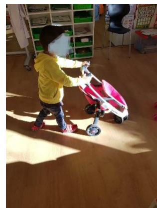
Ilustración 7: Niño jugando con un carrito.

Con esta actividad trataremos de analizar el quinto ODS “la igualdad de género”. Trataremos en primer lugar la igualdad de género dentro del aula con los niños y niñas y posteriormente lo llevaremos al entorno de los alumnos y alumnas como son las profesiones y los colores. Pondremos diferentes imágenes en el ordenador y por el aula se pondrá una imagen de un niño en una esquina, de una niña en otra esquina y de un niño y una niña juntos en otra. Los niños según aquello que aparezca en la imagen deben situarse en un espacio de la clase u en otro según piensen si únicamente puede realizarlo o gustar a un niño o niña o ambos pueden hacerlo o gustar.