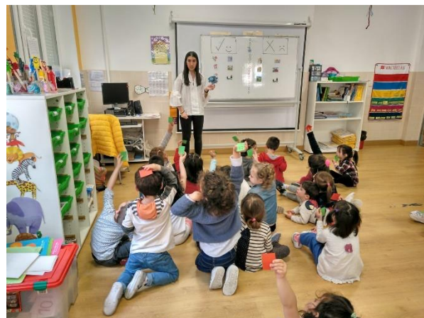
Ilustración 14: Acciones buenas y malas para el agua.