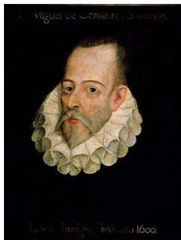
Retrato de Miguel de Cervantes atribuido a Juan de Jáuregui.

Por ello, los estudiosos suelen decir que no hay suficientes indicios sobre la identidad de Avellaneda, y que Cervantes escribió los 58 primeros capítulos de la segunda parte de su Quijote antes de conocer el apócrifo. Sin embargo, ambas cosas son falsas, y ya podemos saber lo que realmente ocurrió.