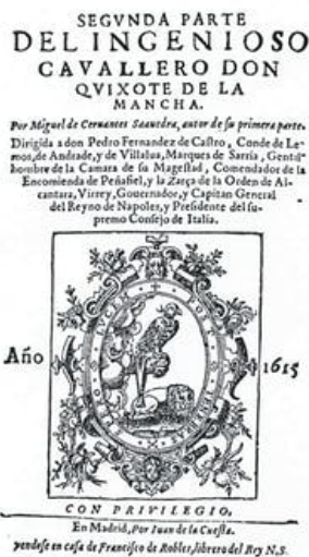
Portada de la segunda parte del Quijote de Cervantes. Alfonso Martín Jiménez