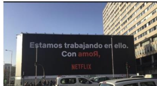
Figuras 2 y 3. Campaña para promocionar la Película Roma en la Plaza de Colón en Madrid.