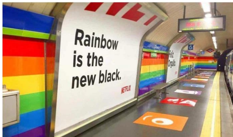
Figura 8. Metro de Chueca en el World Pride Madrid en 2017.