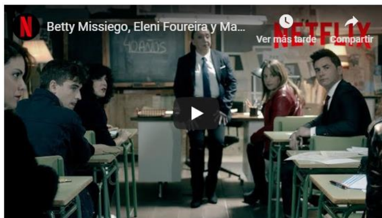
Figura 1. Campaña de La casa de Papel para el lanzamiento de su tercera temporada.