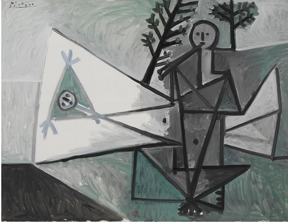
Mujer y tocador de aulos II de Picasso (triángulos y círculos)