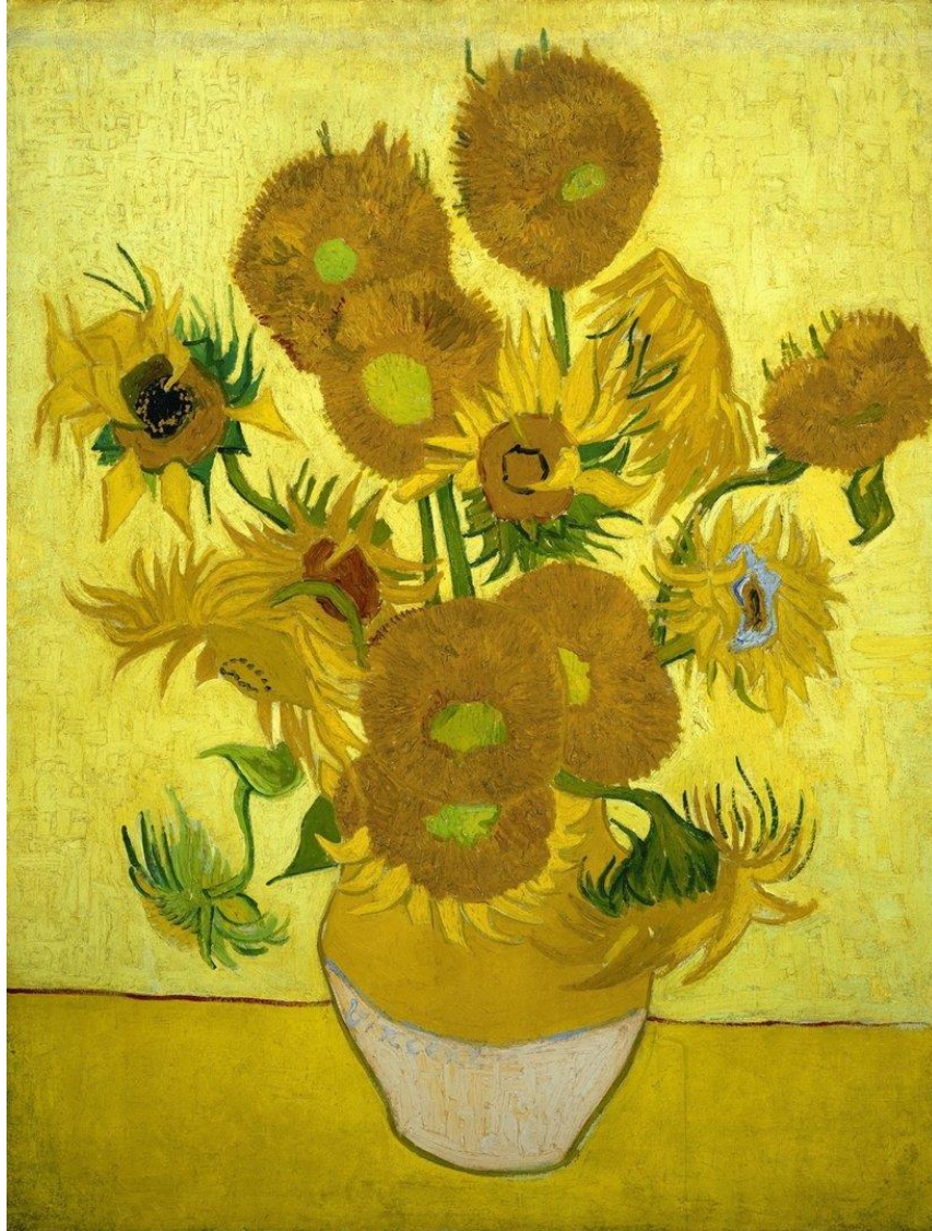
Girasoles de Van Gogh (círculos)