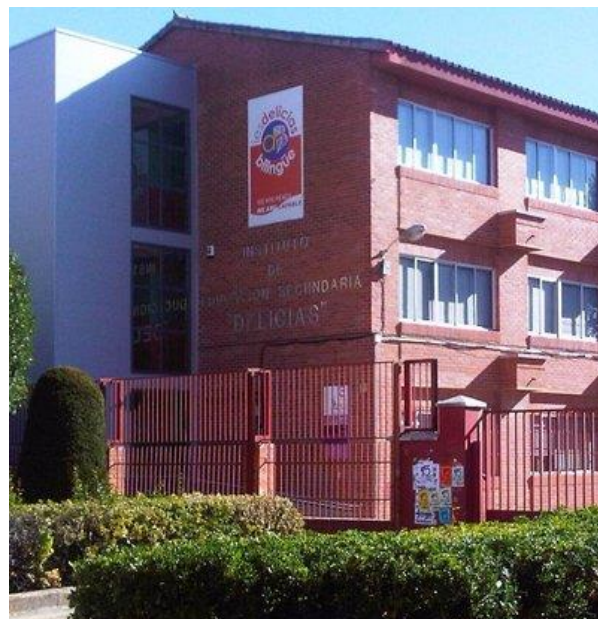
Imagen 1: Fotografía de la fachada del IES Delicias.

El IES Delicias ( Imagen 1 ) se encuentra situado en el barrio vallisoletano de Las Delicias. El origen y desarrollo de este barrio está unido a la incorporación en Valladolid del ferrocarril a mitad del siglo XIX, lo que supuso, además, la creación de los talleres generales de RENFE para la zona Noroeste de España. En los años 50 y 60 del siglo pasado, el barrio recibió nuevos incentivos con la inauguración de industrias del sector automovilístico con sus respectivos talleres auxiliares, que supusieron un importante crecimiento demográfico, otorgando al barrio su identidad, barrio obrero-industrial, con un importante sector terciario de clase media-baja (Amo, 2015).