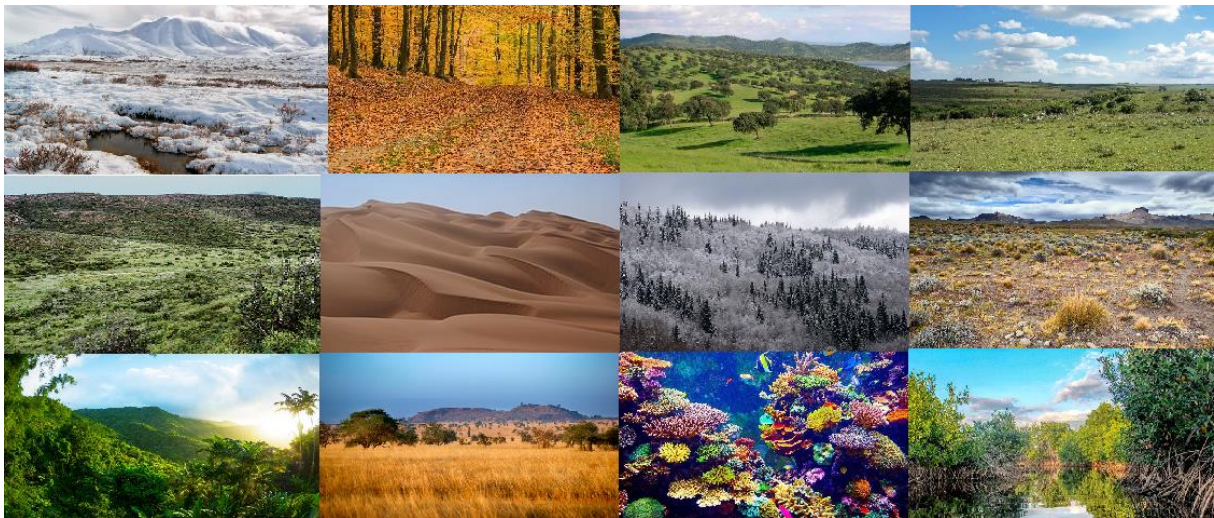
Imagen 3: Fotografías de los distintos biomas a exponer.

La exposición deberá de tener como estructura los siguientes puntos: localización, clima, flora, fauna y amenazas.