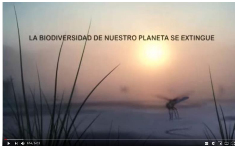
Imagen 2 : Captura del vídeo “La biodiversidad de nuestro planeta se extingue”.

https://www.youtube.com/watch?time_continue=907&v=6CIToJ6AcHI