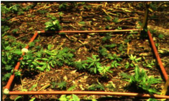
Imagen 5 : Fotografía de un cuadrante 50 x 50.