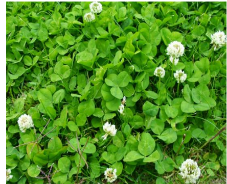
Imagen 7: Fotografía de leguminosa.