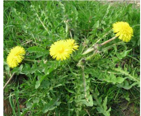
Imagen 6: Fotografía de diente de león