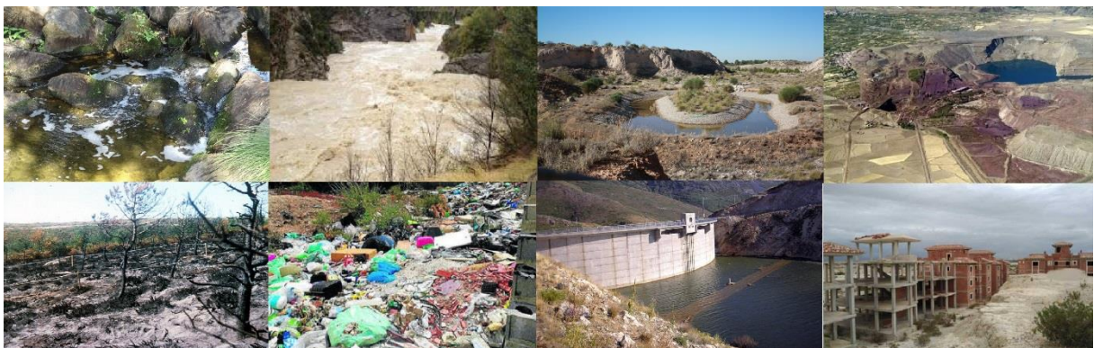
Imagen 9 : Fotografías de los espacios a recuperar