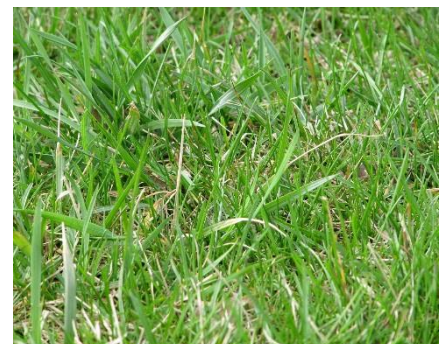
Imagen 8: Fotografía de gramíneas.